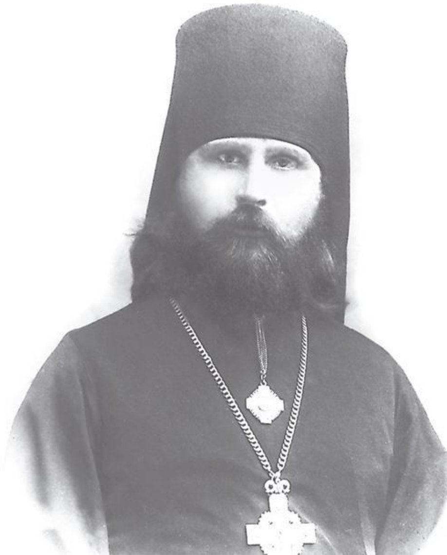
Архимандрит Иларион (Троицкий) – инспектор Московской духовной академии

Верую во едину Святую, Соборную и Апостольскую Церковь