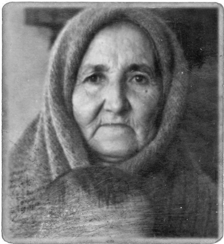
Бабушка Зайнан в возрасте семидесяти лет

Бабушка происходила из духовенства. Ее приглашали в дом читать молитвы по усопшим. В отношении нравственности она была очень строгой. Ей в жизни выпали тяжелые