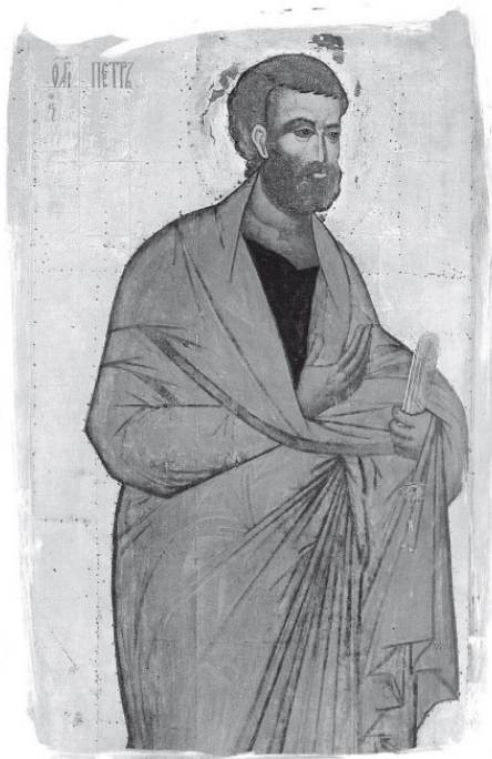
Святой апостол Петр. Икона (фрагмент)

Гнилые слова могут посеять бурю отрицательных эмоций в душе человека и нарушить духовный порядок в жизни семьи.