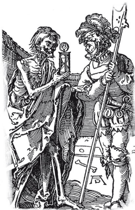
Альбрехт Дюрер. Смерть и рыцарь. Ксилография

В Книге премудрости Иисуса, сына Сирахова, сказано: Испытывай себя прежде суда, и во время посещения найдешь милость (Сир. 18, 20). То есть прежде чем суд еще не наступил, прежде чем еще не начались мытарства, мы должны испытывать себя, и так – до момента нашей физической смерти. Прежде, нежели почувствуешь слабость, смирайся, и во время грехов покажи обращение. Ничто да не препятствует тебе исполнить обет благовременно, и не откладывая оправдания до смерти... Припоминай о гневе в день смерти и о времени отмищения, когда Господь отворотит лице Свое (Сир. 18, 21–22, 24).