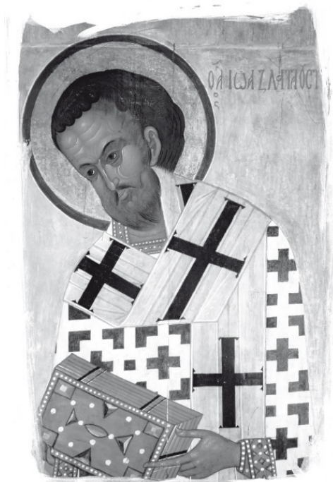
Святитель Иоанн Златоуст. Икона

вписал Он вас”. И сказали мы: “Господь! Праведный Судия! Ты лишил нас благ земных: не лиши небесных. Ты отлучил нас от отцов и матерей: не отлучи от святых Твоих. Знамена Крещения сохранились целыми на нас; тело наше мы представляем Тебе чистым по причине младенчества нашего”» 37 .