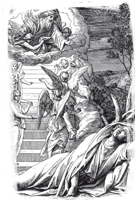
Юлиус Шнорр фон Карольсфельд. Сон Иакова. Гравюра (фрагмент)

А так как ад не предназначен для людей, ибо он уготованный диаволу и ангелам его (Мф. 25, 41), то восхождение на небеса по лестнице, виденной Иаковом и описанной в повествованиях о мытарствах, будет предоставлено каждому человеку. И естественно, бесы и демоны всячески будут препятствовать человекам взойти туда, где некогда обитали и они сами, и диавол, который человекоубийца от начала и не устоял в истине (Ин. 8, 44); и еще: Как упал ты с неба, денница, сын зари! разбился о землю (Ис. 14, 12). Только мученики и великие святые восходят на небеса, минуя мытарства. По Церковному Преданию, Пресвятая Дева Мария в пречистом теле вознеслась на небеса. Об этом свидетельствуют молитвословия и восхваления праздника святого Успения.