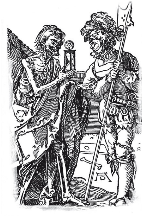
Альбрехт Дюрер. Смерть и рыцарь. Ксилография

оправдания до смерти... Припоминай о гневе в день смерти и о времени отмищения, когда Господь отвертит лице Свое (Сир. 18, 21–22, 24).