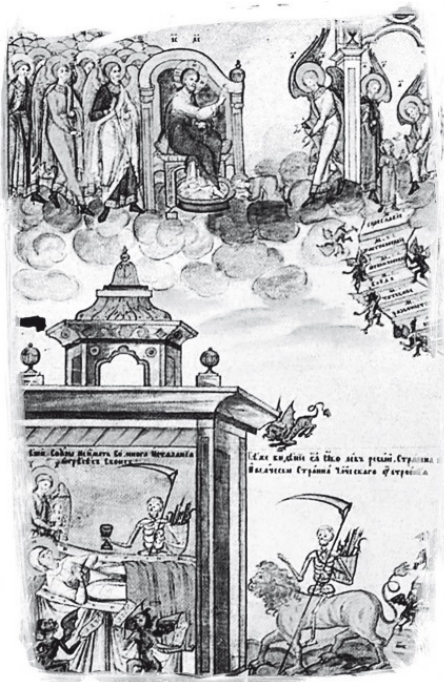
Смерть святой Феодоры и видения мытарств. Лубок (фрагмент)

Святитель Григорий Двоеслов, папа Римский, говорит: «Надобно основательно размышлять о том, коль страшен будет для нас час смертный, какой ужас души, какое воспоминание всех зол, какое забвение протекшего счастья, какой страх и какое опасение Судии... Когда злые духи в отходя-