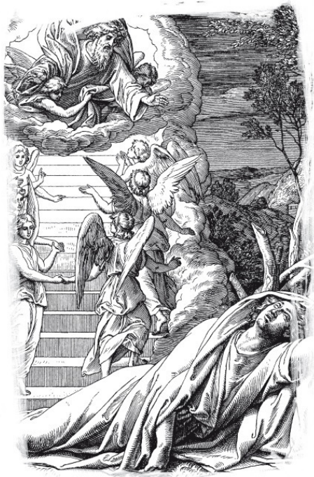
Юлиус Шнорр фон Карольсфельд. Сон Иакова. Гравюра (фрагмент)

А так как ад не предназначен для людей, ибо он уготованный диаволу и ангелам его (Мф. 25, 41), то восхождение на небеса по лестнице, виденной Иаковом и описанной в повествованиях о мытарствах, будет предоставлено каждому человеку. И естественно, бесы и демоны всячески будут пре-