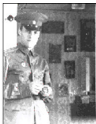
Вид из комнаты в прихожую

В нашем доме было просторно и светло – квартира была хорошей. К этому времени у нас набралось множество всяческих мелких вещичек: статуэток, кувшинчиков, вазочек и сувениров, которые были расставлены на специальных полочках или развешены по стенам.