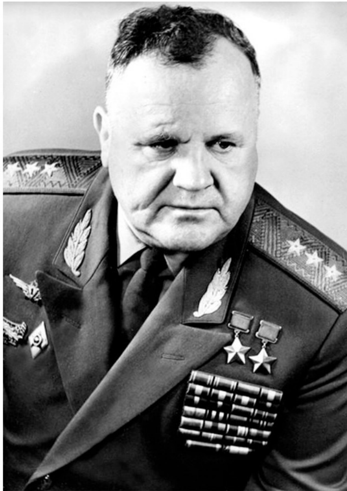
Николай Дмитриевич Гулаев