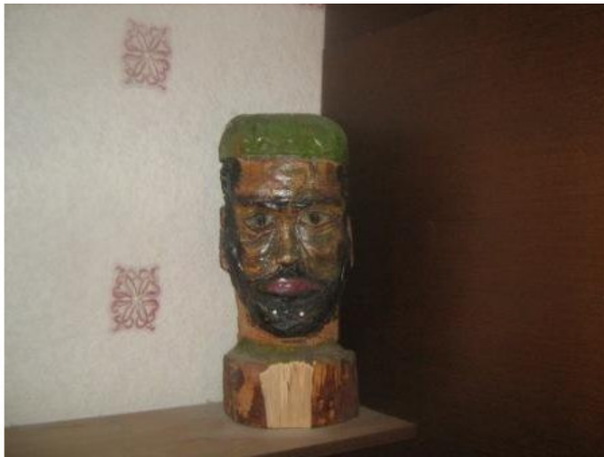
Моя работа. Вырублено топором, отделано стамеской и молотком