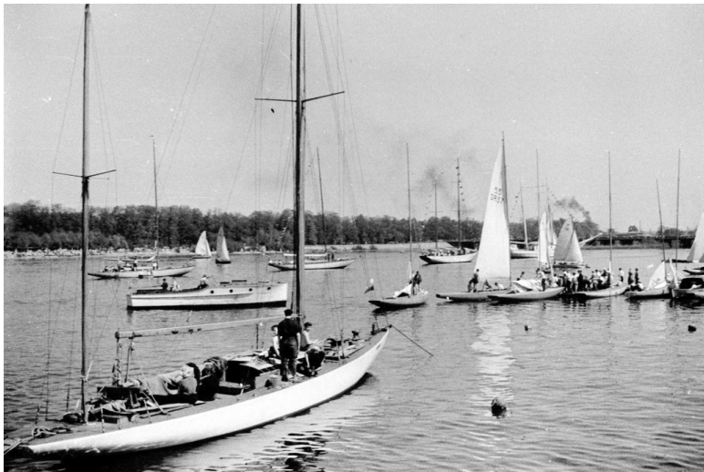
Парад яхт в честь праздника открытия навигации 1956 год