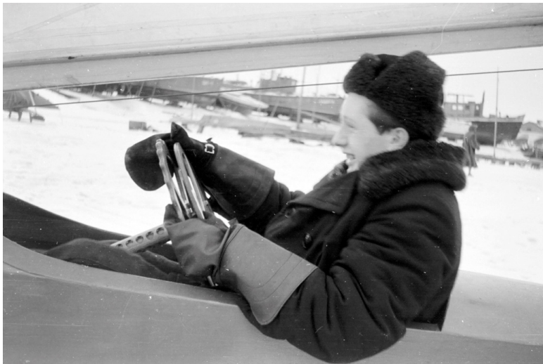
Позирую на своей «восьмерке». Декабрь, 1957 г.