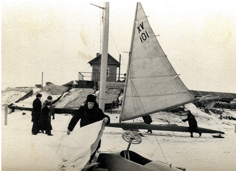
Подготовка моего восьмиметровика к выходу Декабрь 1957 года