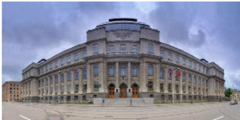
Всероссийский научно-исследовательский геологический институт им. А. П. Карпинского

В 1981 году мне было семь лет. Я жила с мамой и папой в Ленинграде (ныне Санкт-Петербург). Родители мои – геологи и работали во ВСЕГЕИ (Всесоюзный геологический институт). Это было величественное здание с высокими колоннами и широкими лестницами, как в Эрмитаже. Храм науки!