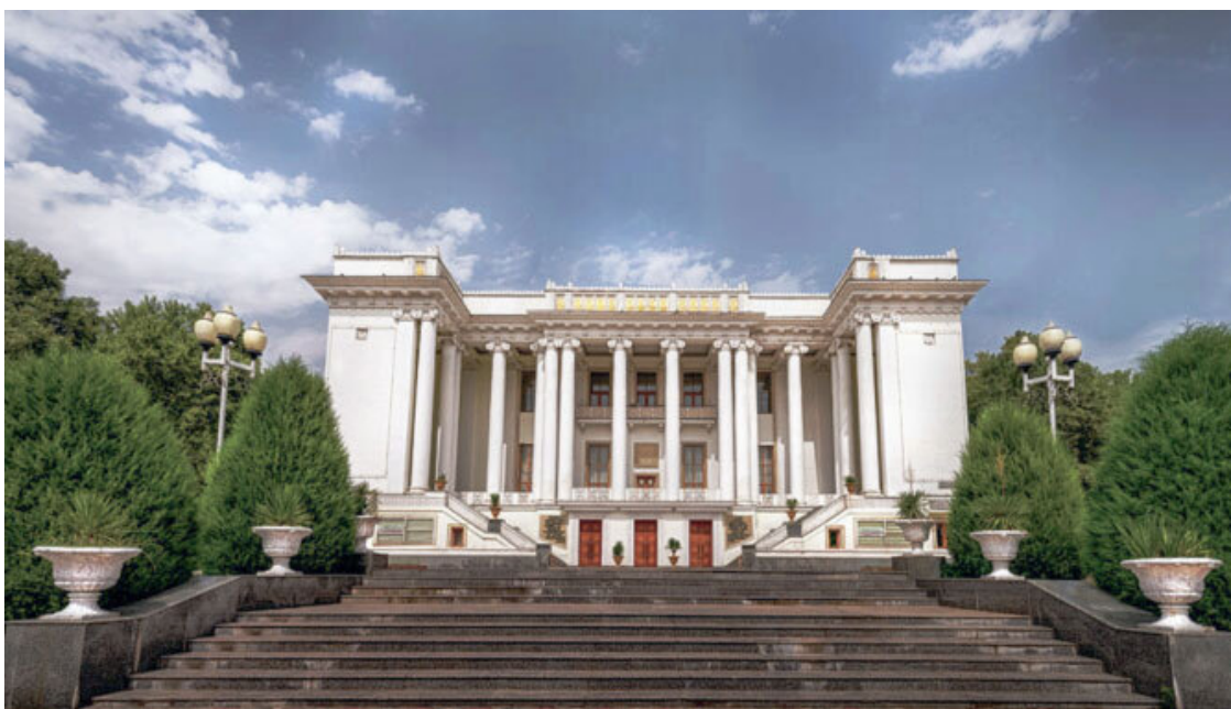
Таджикский государственный академический театр оперы и балета имени Садриддина Айни. Основан в Душанбе в 1936 году

Я родилась и первые годы своей жизни провела в Душанбе, пока родители не переехали жить и работать в Ленинград. Мои воспоминания о родном городе по-детски прекрасны. Это дом: бабушка, теплый воздух, запах фруктов, муравьи на кухне, печак, «зеленый» базар, прохладный линолеум на полу, пластинки, запах книг, лоджия с огромным зеркалом, журчащие арыки, асфальт плавится, сидячая ванна, розовые аллеи, плакучие ивы, виноградные лозы над головой, чай из пиалушек, ароматные лепешки с кунжутом, деревья со сладким тутовником, черешневые сады, песчаные афганцы-ураганы и, конечно, оперный театр! В оперный театр, который считался душой города, бабушка меня водила часто (по крайней мере, я так запомнила).