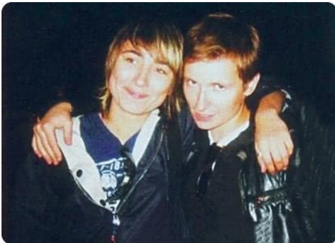
Земфира и Диана