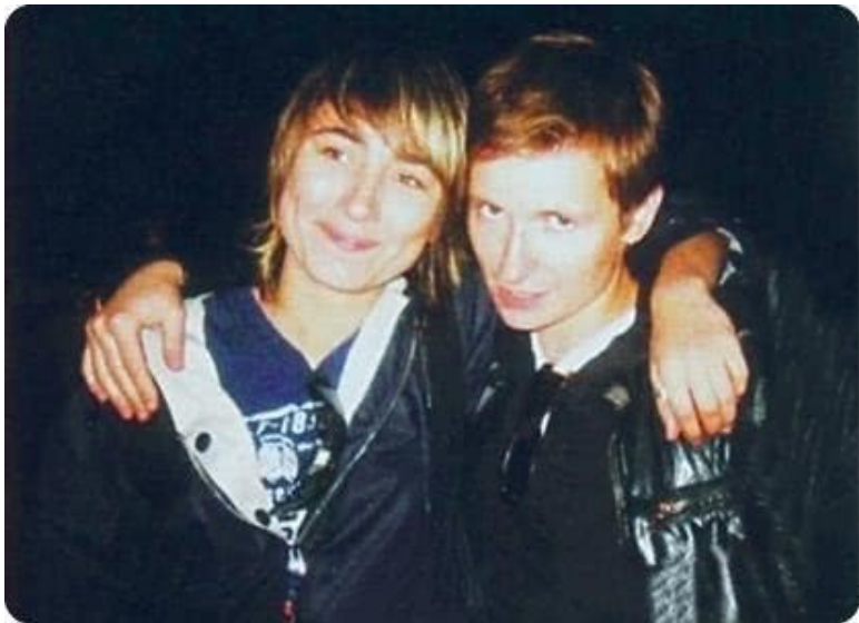
Земфира и Диана

В постсоветской истории ситуация изменилась быстро и кардинально. До гендерного паритета в русском роке, конечно, не дошло (и вряд ли когда-нибудь дойдет). Однако сформировать (при желании) броский лайн-ап для фестивальной афиши исключительно из популярных рок-исполнительниц стало возможно уже на пороге миллениума. Земфира, Диана Арбенина, Светлана Сурганова, Хелависа, Маша Макарова, Ольга Арефьева, Юлия Чичерина. Назы-