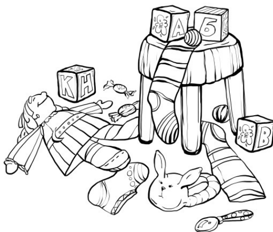
Рисунок на переплете – Ирина Шкловер

Редакционно-издательская группа «Жанровая литература»