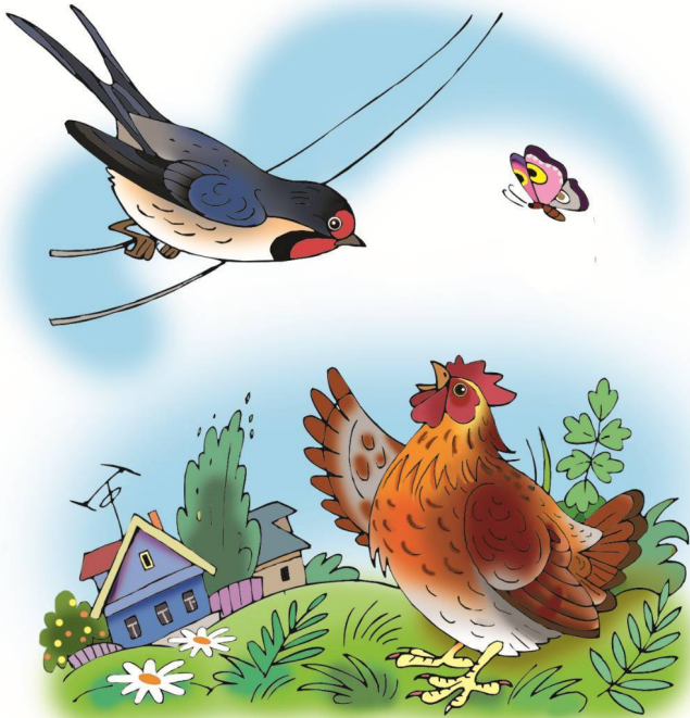
Ласточка и Курица