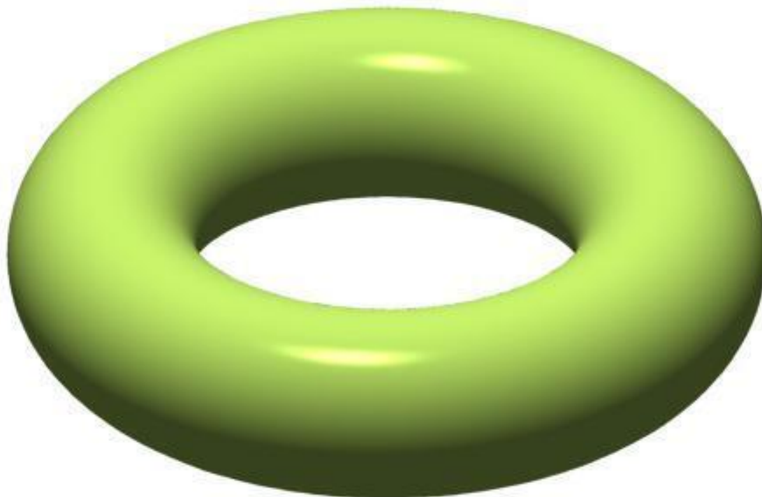
Рисунок 2 Фигура тор

Сплошной шар из материи, возможен только лишь в двух случаях: если материю слепить некой силой в сплошной шар, или залить полый шар (некую шарообразно скорлупу) материей.