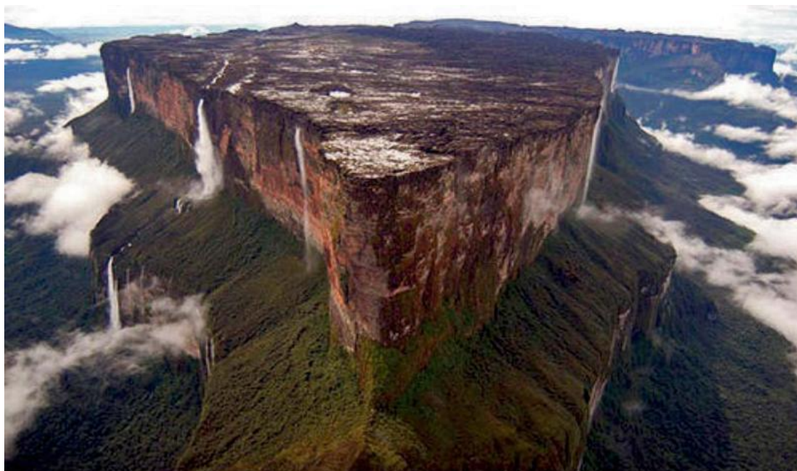
Рисунок 4 Гора Рорайма и водопады с горы

Максимальный поток воды с горы Рорайма равен примерно трестам кубическим метрам в секунду. Для наглядности, например, если всю площадь горы покрыть водой глубиной в один метр, то вся вода стечёт через водопады за одни сутки. Вокруг этих столовых гор растут непроходимые джунгли, на самих горах растут цветы, ни о каких безжизненных скалах не может быть и речи.