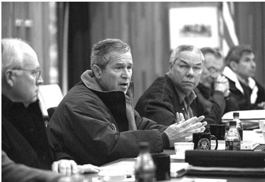
Президент Джордж Буш-младший встречается со своим Советом национальной безопасности в Кэмп-Дэвиде через четыре дня после событий 11 сентября. Слева направо: вице-

В марте 1993 года некто слил это новое «Руководство по оборонному планированию» в New York Times . Публикация породила настоящее цунами критики. Чейни, Вулфовицу и другим пришлось публично отказаться от наиболее одиозных постулатов своего детища. Однако неоконсерваторы не отступились от дела. В 1997 году они создали организацию «Проект Нового американского столетия» (ПНАС). В 2000 году Верховный суд США, к своему вечному стыду, проигнорировал голоса избирателей и официально признал президентом США Джорджа Буша-младшего. Члены ПНАСа заполнили должности в новой администрации и сразу начали пропагандировать свое видение мира. На первой неделе президентства Буша корреспондент газеты Los Angeles Times Робин Райт точно описал их агрессивную однополярность: «Исходное условие новой доктрины состоит в том, что США могут делать практически все, что хотят, потому что их развитая демократия ставит страну, политически и морально, выше всего остального мира, а иной раз даже освобождает от соблюдения международных норм и конвенций». Восемь месяцев спустя 11 сентября предоставило им «новый Перл-Харбор», о котором они мечтали 11 . Через месяц США вторглись в Афганистан. Через полтора года наступила очередь Ирака. И неоконсерваторы начали открыто славить Американскую империю.