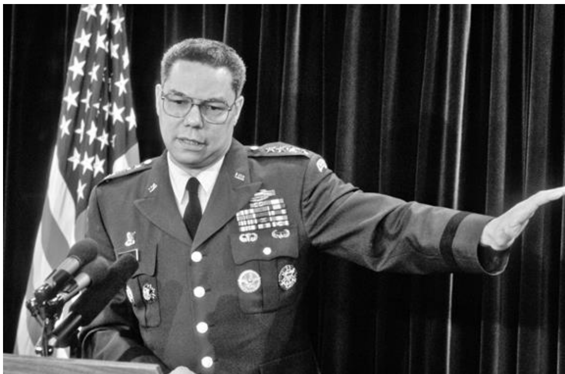
Генерал Колин Пауэлл на брифинге для журналистов по поводу операции «Буря в пустыне» (пресс-центр Пентагона, 24 января 1991 года)

Триумфалистская концепция Краутхаммера, впервые представленная им в сентябре 1990 года на лекции в честь Генри Джексона, появилась в журнале Foreign Affairs под названием «Однополярный момент» (The Unipolar Moment). Он осудил тех, кто предсказывал после холодной войны наступление многополярного мира и приветствовал его вместо того, чтобы с удовольствием предвкушать, как США станут «единственным глобальным полюсом силы» на предстоящие десятилетия, потому что, по его мнению, Соединенные Штаты – «единственная страна, имеющая военные, дипломатические, политические и экономические средства, чтобы играть решающую роль в любом конфликте в любой части света, куда она посчитает нужным вмешаться». Однако Краутхаммер ожидал, что США будут входить в «период нарастания, а не уменьшения угрозы войны». На этот раз угрозу составит уже не одна конкурирующая супердержава. Опасность создадут «небольшие агрессивные государства, обладающие оружием массового уничтожения и средствами их доставки». «Главная надежда на безопасность» в такие «экстраординарные времена», в эту «эру оружия массового уничтожения», – как заключил Краутхаммер, связана с «американской силой и волей... возглавить однополярный мир, без оглядки на других устанавливая законы мирового порядка и поддерживая готовность заставить всех выполнять эти законы» 9 .