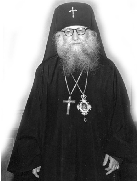
Архиепископ Брюссельский и Бельгийский Василий (Кривошеин) (1900–1985)