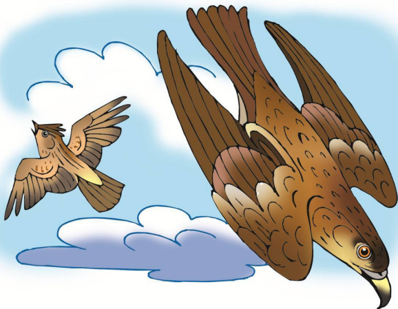
Коршун и Жаворонок

Покуда хвастала, налетела гроза, ударила молния, попала в самое высокое дерево и сожгла его дотла.