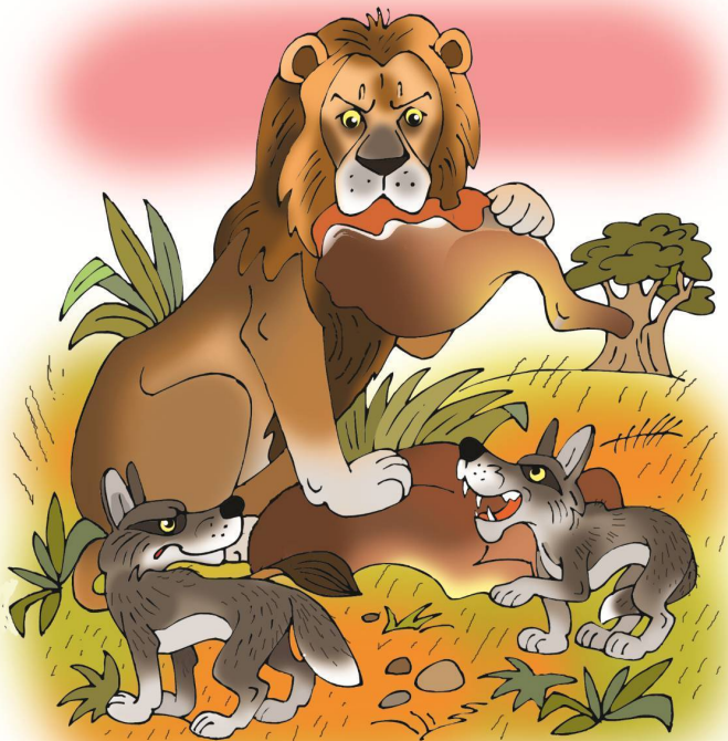
Лев и Шакалы