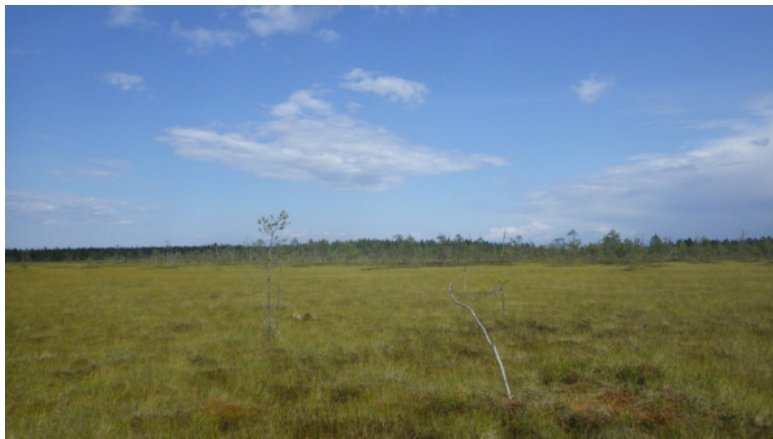
Шуерецкие болота, фото 2014 года