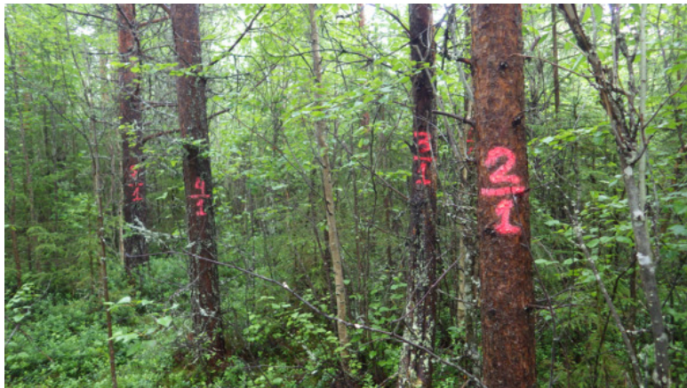
Точка учёта №1.

в одном и том же месте. Кстати костровище 2010 года у вывороченной сосны, где в ямке от корней разводили тогда костер, практически не видно. И только палочка с рогулькой напоминает тот засушливый год. Сейчас спустя 5 сезонов видно, что присутствие человека в лесу не вечно. Что касается прошлогоднего костровища, то сквозь угли уже тоже начали прорастать травки муравки.