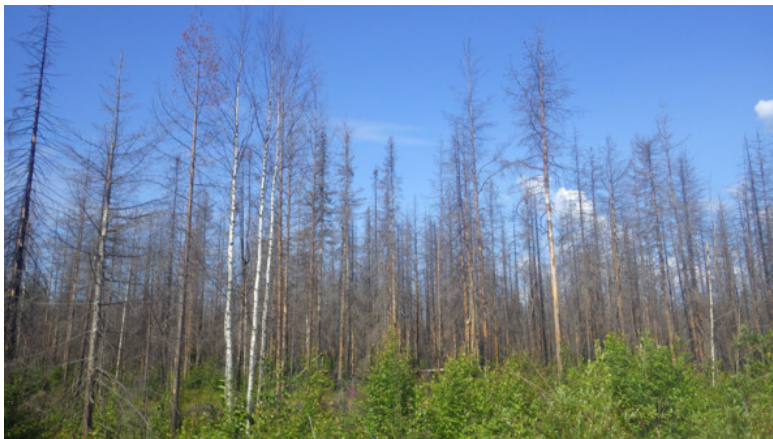
Погибшее сосновое насаждение. Практически всё 6 КСС.