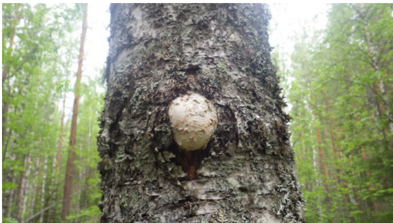
Кап на берёзе