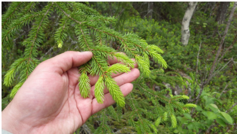
Текущий побег ели.