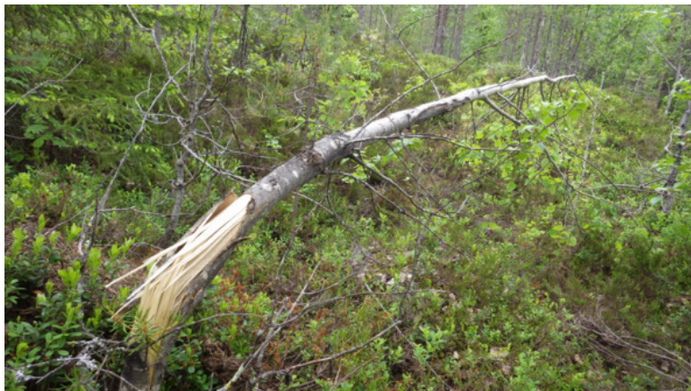
Осину заломал медведь