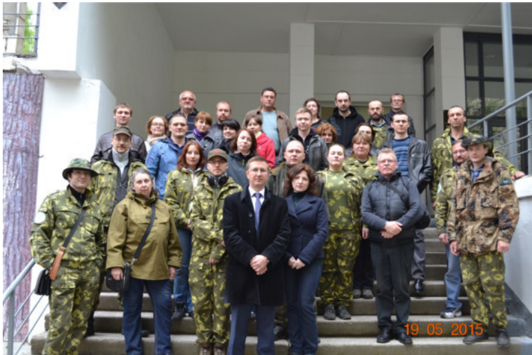
Коллективное фото, фотографирует Плеханов Алексей.