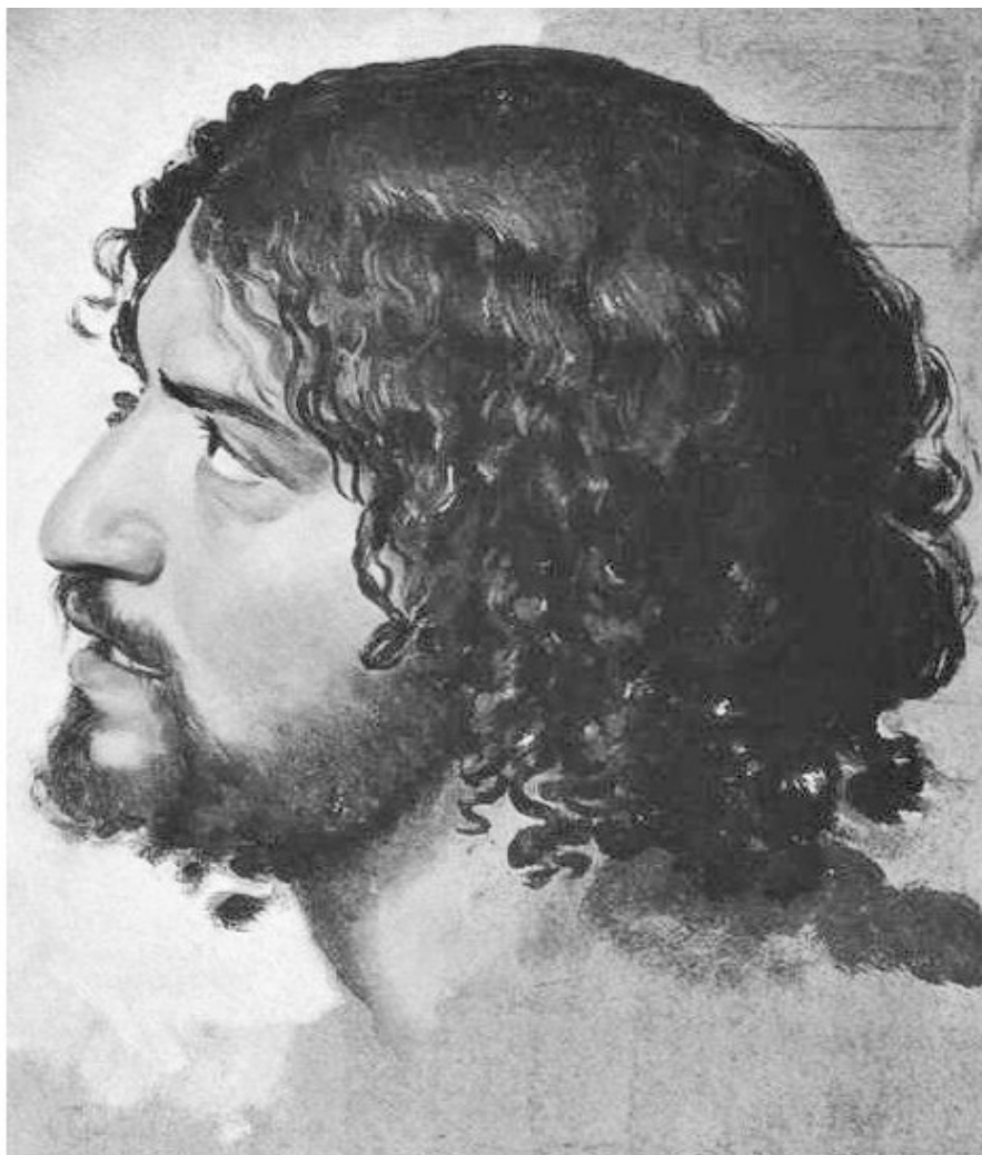
Эскиз головы иудея к картине «Явление Христа народу» Иванов А. А. 1842г.

Для учения ессеев и ранних христиан были характерны общие идеи о конце мира, о борьбе добра и зла, учение о предопределенности Богом всех событий в мире, резкое осуждение жертвоприношений. Ессеи не получили такого распространения как христианство из-за своей замкнутости, отсутствия широкой проповеди, в том числе об уже свершившемся приходе Мессии – Христа.