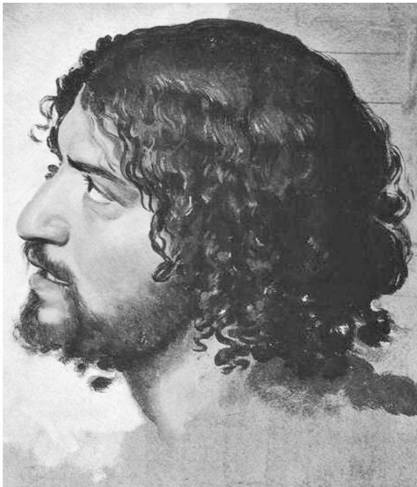
Эскиз головы иудея к картине «Явление Христа народу» Иванов А. А. 1842г.

Как видно, на начальном этапе своего существования христианство было одной из многих иудейских сект. Однако уже к концу I в. н. э. в христианство стали вливаться элементы не еврейского происхождения. Нам известно о широком распространении у многих народов Востока культов богов-спа-