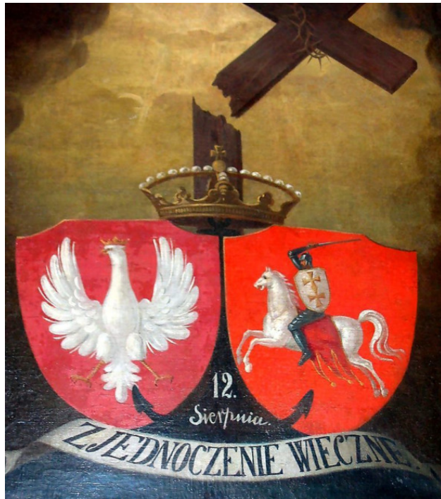
Плакат в память о Кревской Унии.