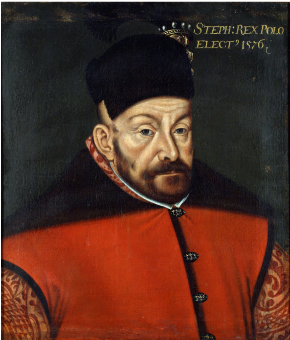
Король Стефан Баторий, портрет 16 века. Главный противник московских царей.