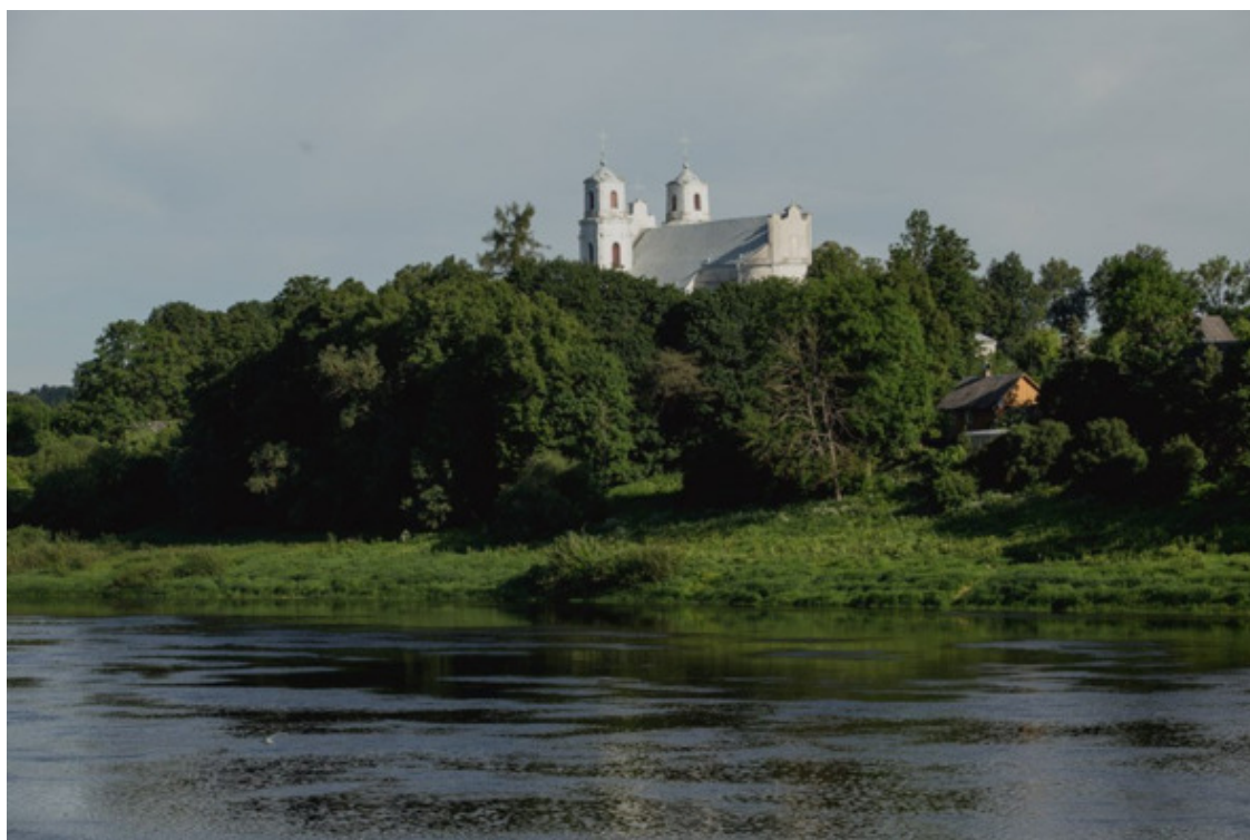
Друя.