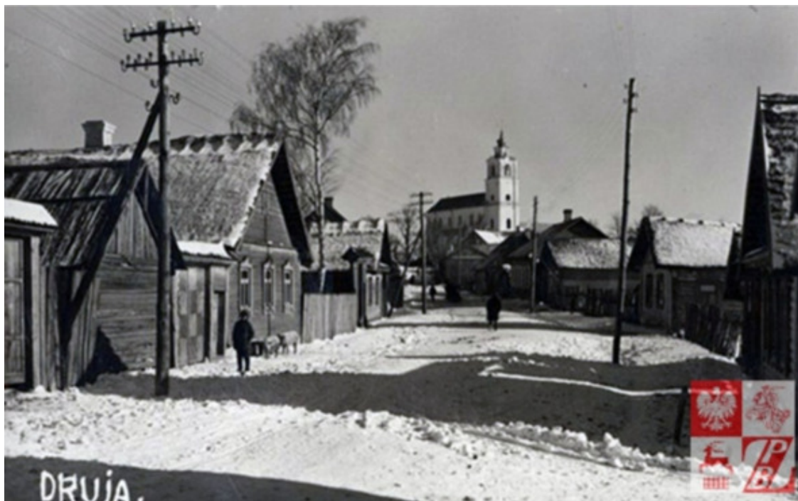
Druja w 1936 roku.

Год 1909-й. Это был год уничтожения находившихся в центральной части Друи руин костела св. Антония.