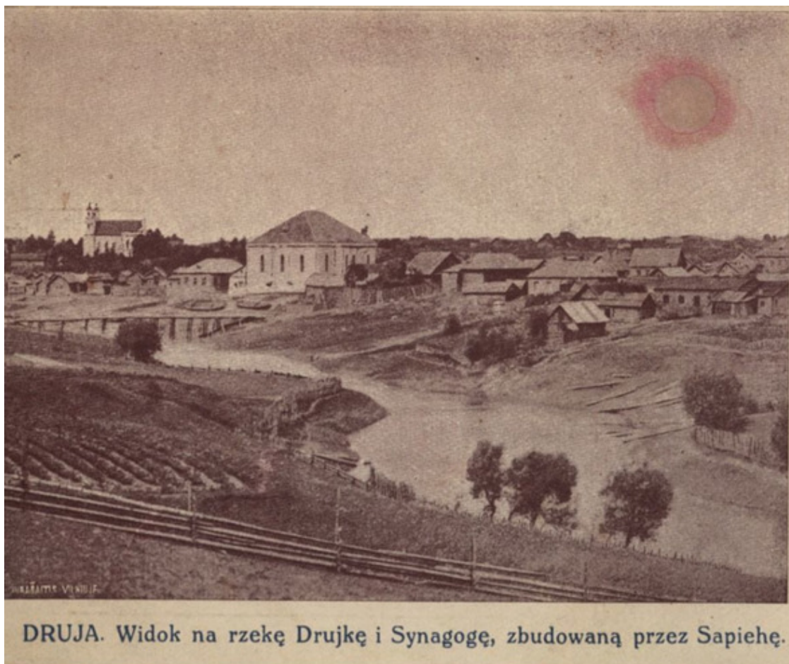
Фото – Друя на старинной фотографии (видна синагога).

Друя является находящимся в Беларуси городком, где в прежние времена в большом количестве проживали евреи (в 1910-м году численность евреев в Друе равнялась 4 849 человек или 86,5 процента от общей численности населения). Сегодня в ней находится неплохо сохранившееся старое еврейское кладбище. Евреи же в Друе давно не проживают... последний еврей покинул эти места в 1958-м году.