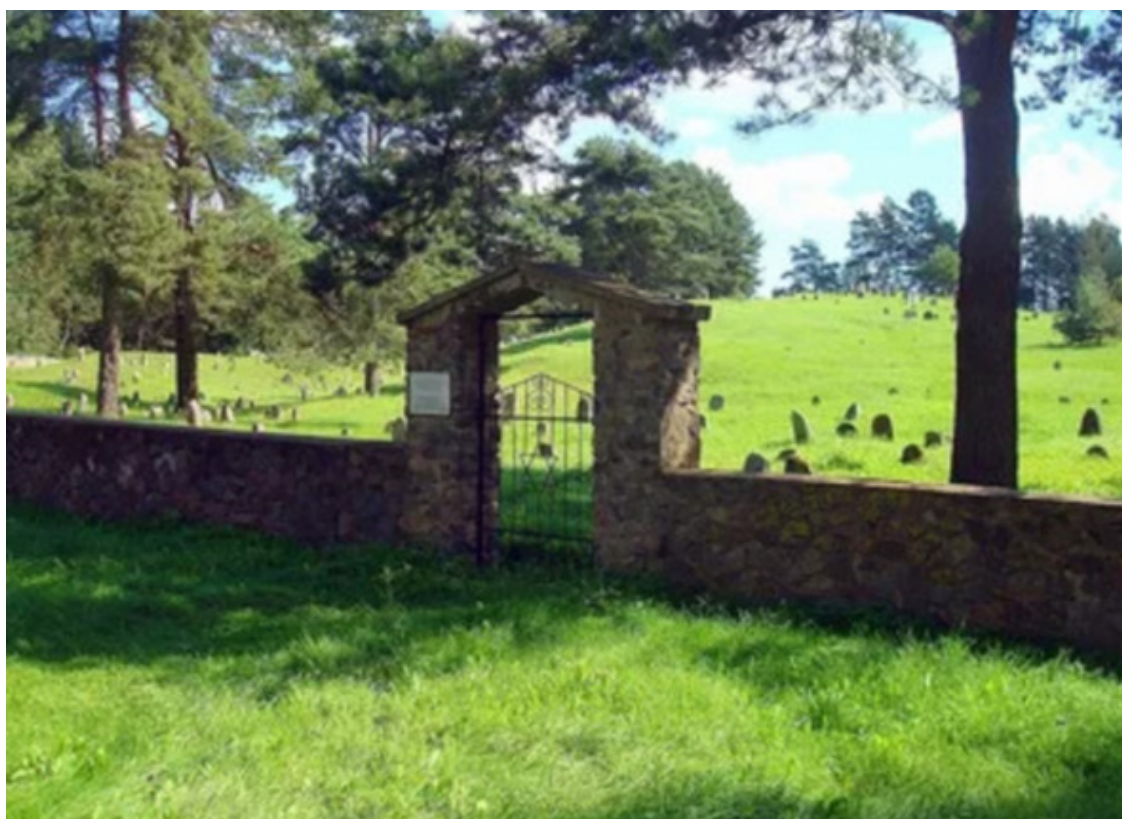
Еврейское кладбище в Друе.