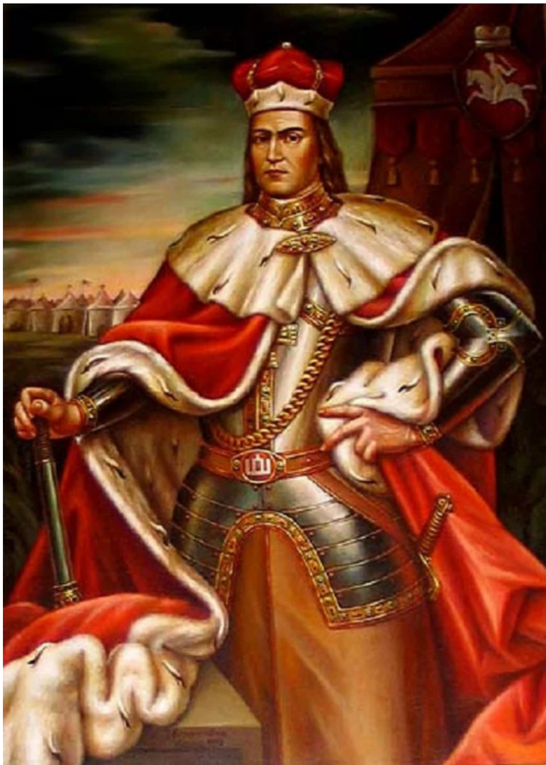
Витовт – Великий князь Литовский.