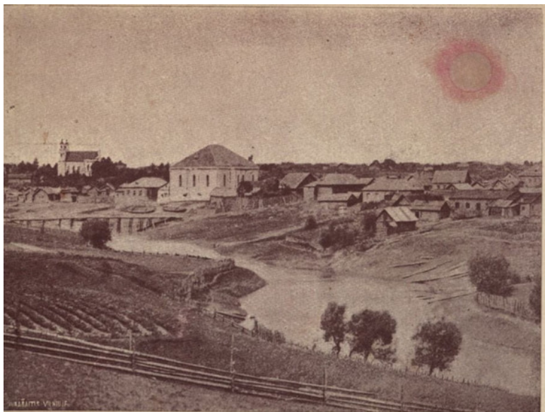
DRUJA. Widok na rzekę Drujkę i Synagogę, zbudowaną przez Sapiechę.

Фото – Друя на старинной фотографии (видна синагога).