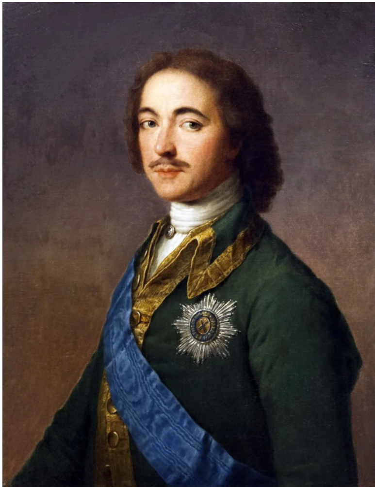
Император Петр 1.