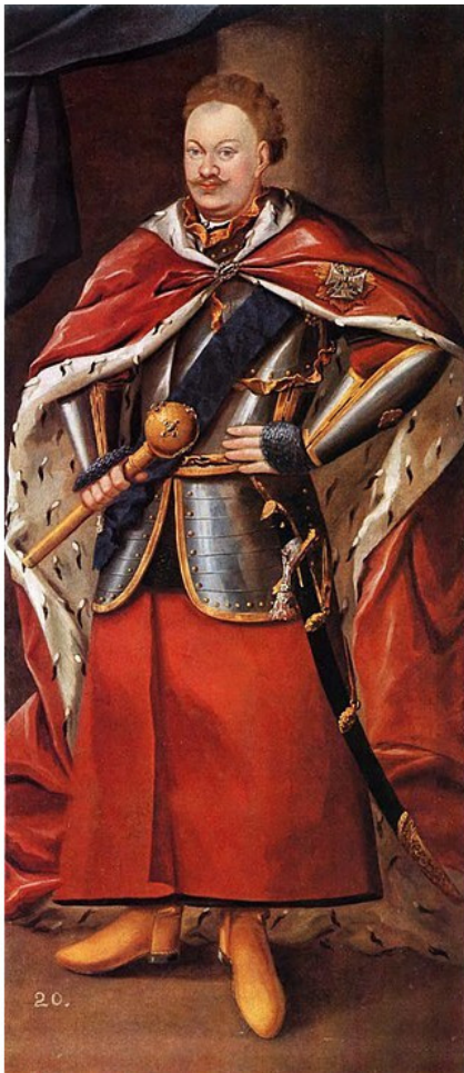
«Князь Михаил Серваций Вишневецкий (польск. Michał Serwacy książę Wiśniowiecki; 13 мая 1680, Львов – 16 сен-