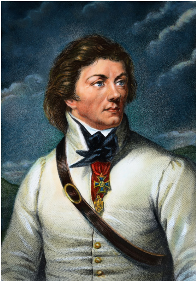
Тадеуш Костюшко портрет. «Анджей Тадэуш Бонавентура Костюшко (Косцюшко) (польск. Andrzej Tadeusz Bonawentura Kościuszko, белор. Андрэй Тадэвуш Банавентура Касцюшка, лит. Andrius Tadas Bonaventūra Kosciuszka;