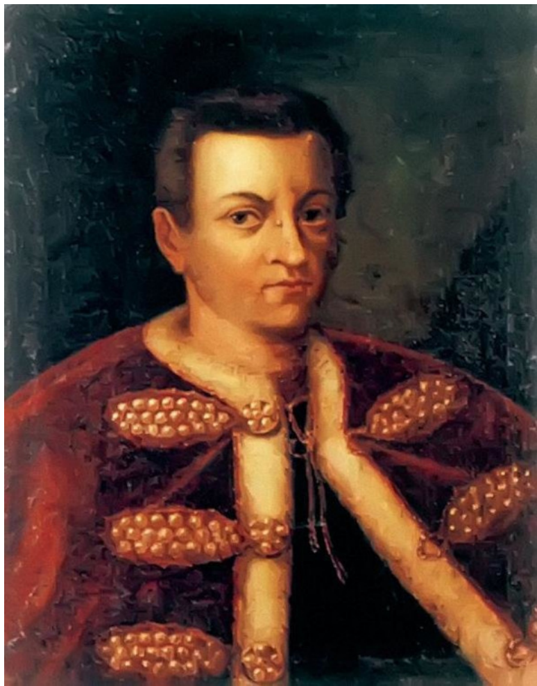
Григорий Отрепьев (Лжедмитрий I). Ис-