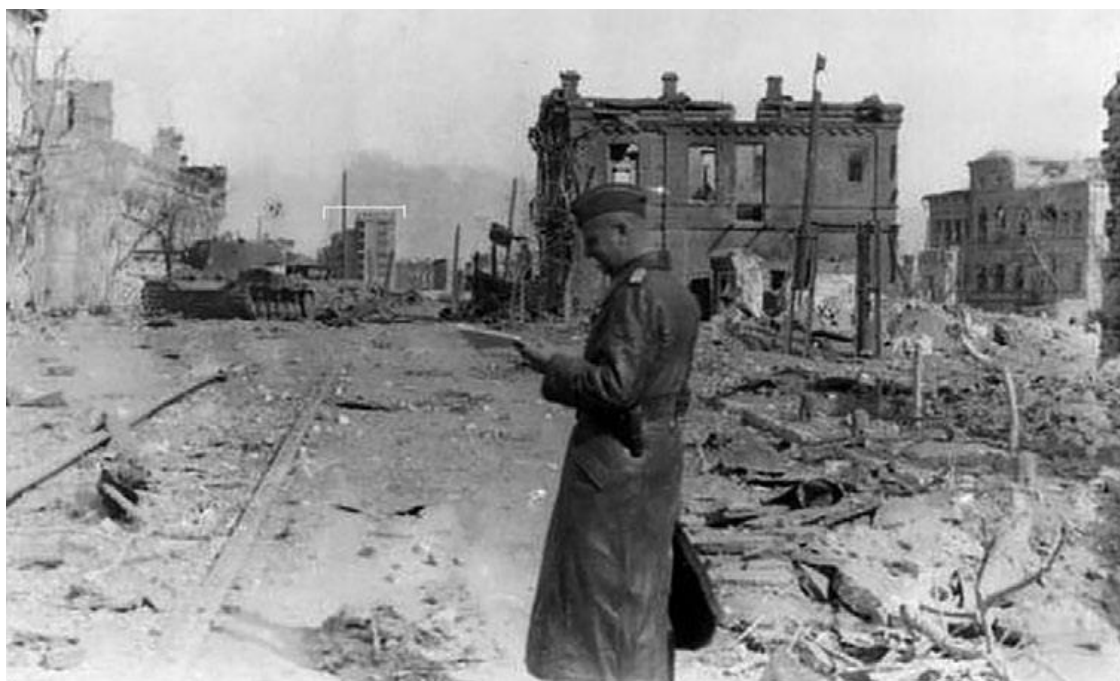
На немецком фото – подбитый KB-1 из состава 133-й тбр на улице Советской, идущей от Астраханского моста (октябрь 1942 г.)