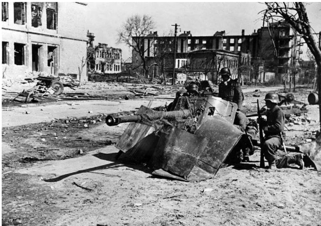
Расчет немецкого 50-мм противотанкового орудия Pak 38 на перекрестке улиц Саратовская и Курская. Немцы ждут атаки с юга, где в районе площади Павших Борцов слышна перестрелка