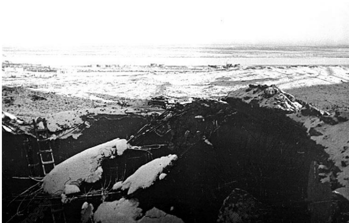
Остатки водонапорного бака на вершине Мамаева кургана, зима 1943-го. В центре снимка виден подбитый «штуг»

На следующий день, 17 сентября, сводный полк 112-й стрелковой дивизии и 39-й гвардейский полк получили приказ командарма перейти в наступление по юго-западным склонам Мамаева кургана в направлении центра города и железнодорожной линии. Но господствующая в небе авиация и огневые точки противника в зданиях у подножия кургана сделали наступление невозможным, полки понесли большие потери. Из района «Красного Октября» по скоплению немецкой пехоты и техники на западных склонах Мамаева кургана вела артиллерийский огонь железнодорожная (морская) батарея, состоявшая из трех 152-мм орудий.