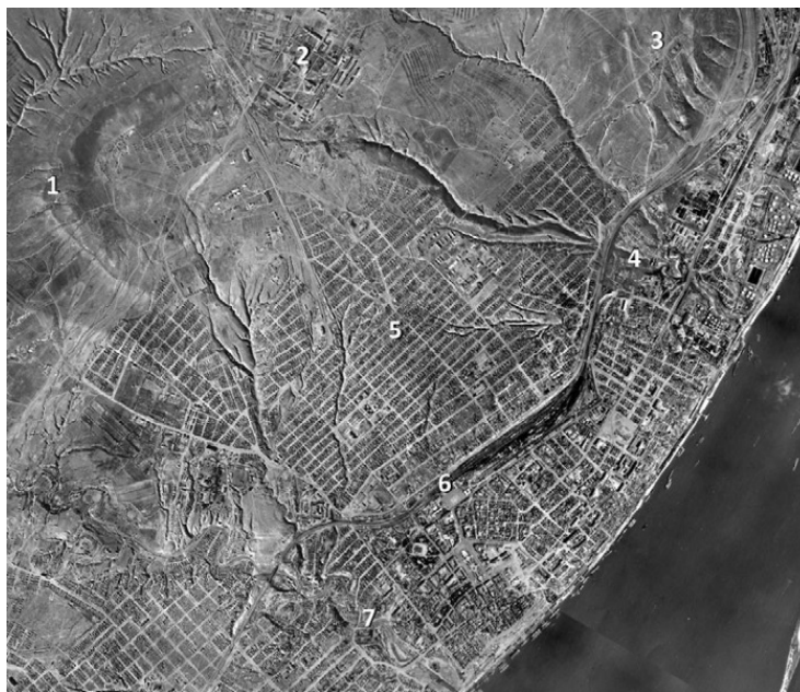
Немецкое аэрофото от 17.09.42. Центральный (Ерманский район) Сталинграда. Схема расположения объектов: 1 – высота 112.5; 2 – Авиагородок; 3 – высота 102.0 (Мамаев курган, район баков); 4 – овраг Долгий; 5 – т. н. «заполотновский» район; 6 – вокзал Сталинград I; 7 – долина реки Царицы