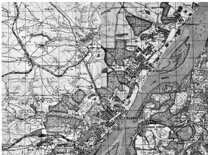
Фрагмент советской карты 1941 г. 1:50 000 с указанными в тексте населенными пунктами

С юга-запада к Ворошиловскому району Сталинграда подходили части 4-й танковой армии Гота – 24-я танковая, 94-я пехотная и 29-я моторизованная дивизии, отрезая советскую 62-ю армию от 64-й Шумилова в районе пригородов Минино и Купоросный. В воздухе полностью господствовали самолеты люфтваффе, высоты на окраинах были заняты немецкими корректировщиками – вытянувшийся вдоль Волги город был как на ладони.