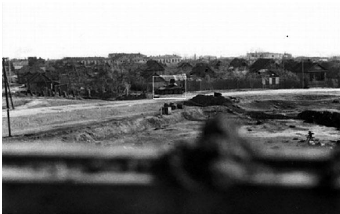
Одна из уничтоженных машин 6-й тбр, перекресток улиц Невской и Карской, т. н. «заполотовский» район.