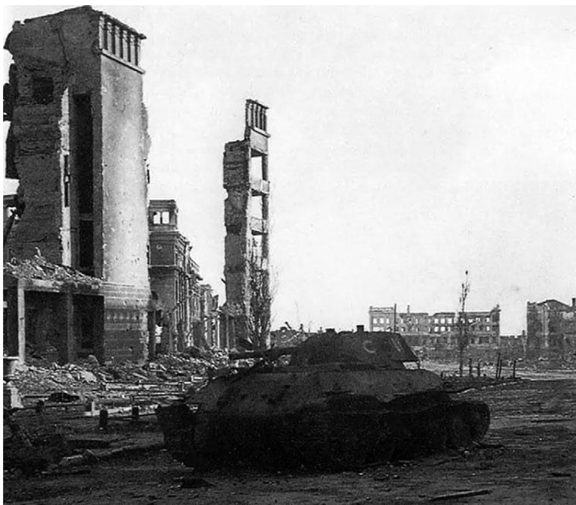
Последний танк 6-й тбр на улице Гоголя