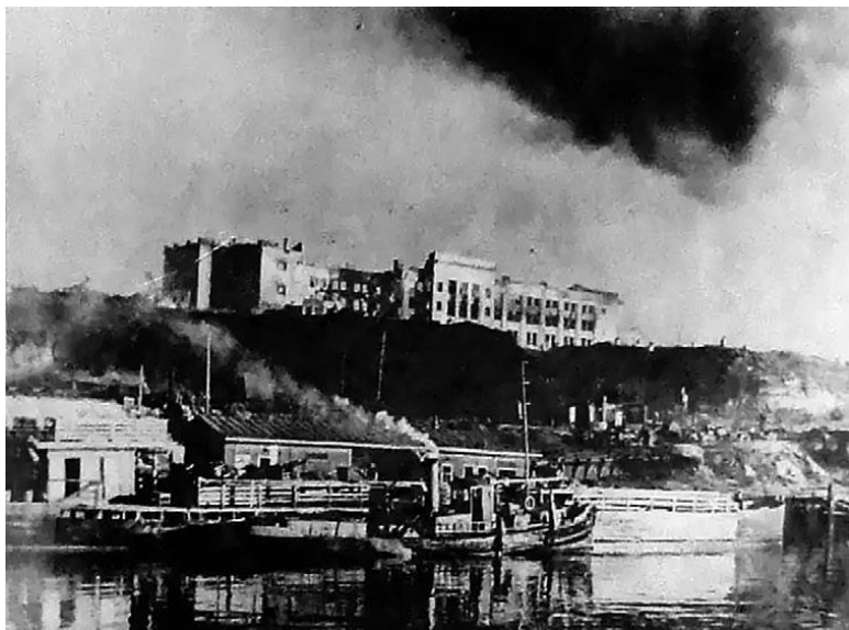
Здание Госбанка после августовской бомбардировки

В течении ночи с 14 на 15 сентября следом за подразделениями 42-го гв сп переправился 34-й гвардейский полк под командованием подполковника Д. И. Панихина. При переправе в катер с бойцами попал снаряд, утонуло 12 человек. Моторист другого катера отказался буксировать баржу к берегу и был расстрелян. В 10:00, когда уже рассвело, последним успел переправиться штаб дивизии и ее комдив. По пути бронекатер попал под огонь немецких пулеметов из захваченного здания Госбанка, был ранен дивизионный инженер.