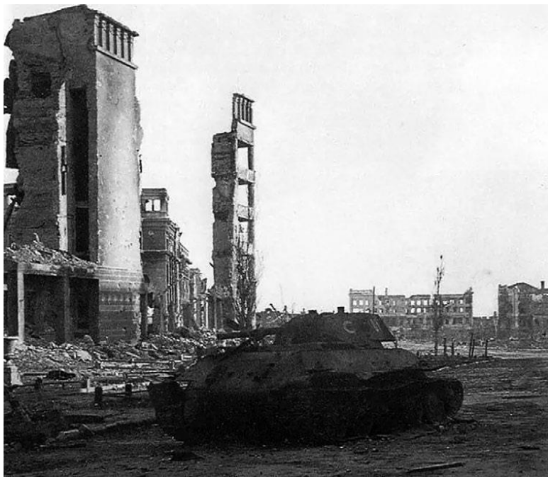
Последний танк 6-й тбр на улице Гоголя