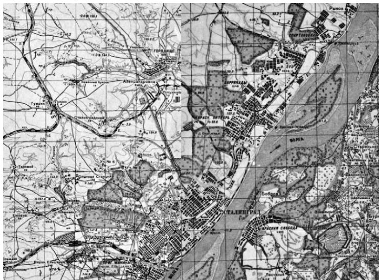
Фрагмент советской карты 1941 г. 1:50 000 с указанными в тексте населенными пунктами

С юга-запада к Ворошиловскому району Сталинграда подходили части 4-й танковой армии Гота – 24-я танковая, 94-я пехотная и 29-я моторизованная дивизии, отрезая советскую 62-ю армию от 64-й Шумилова в районе пригородов Минино и Купоросный. В воздухе полностью господствовали самолеты люфтваффе, высоты на окраинах были заняты немецкими корректировщиками – вытянувшийся вдоль Волги город был как на ладони.