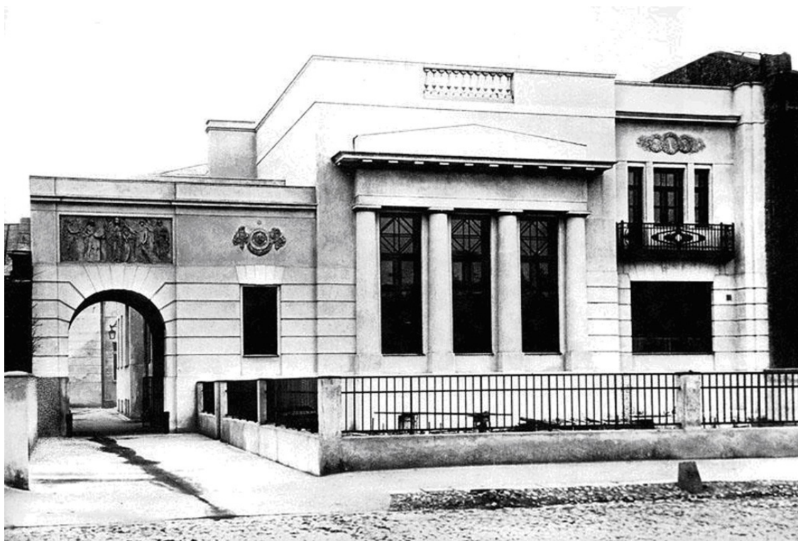
1920-е гг. Бывший дом архитектора Шехтеля близ Малой Бронной улицы.

Это тот самый «маленький беленький особнячок» рядом с Малой Бронной, где Булгаков поселил профессора Кузьмина, «специалиста по болезням печени», и где после визита буфетчика воробышек на столе профессора отплясывал фокстрот и омерзительно гадил в чернильницу: