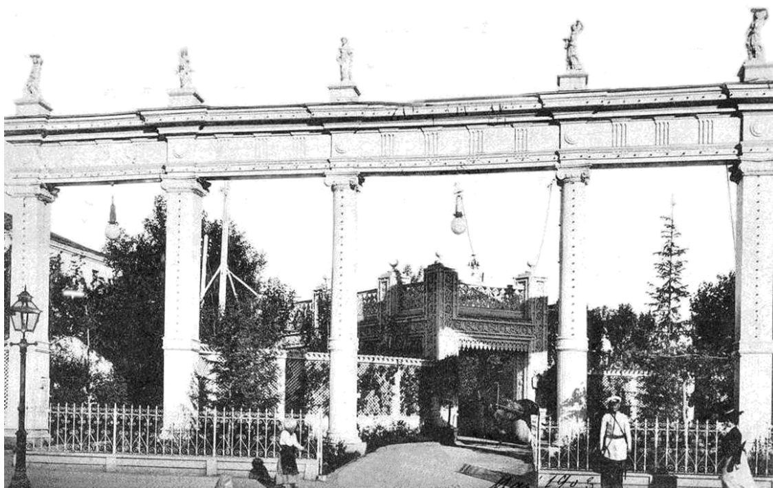
1900 г. Вход в сад «Аквариум» на Большой Садовой улице.

минаций. В начале прошлого века Шарль Омон, владелец театра «Буфф», арендовал сад «Чикаго».