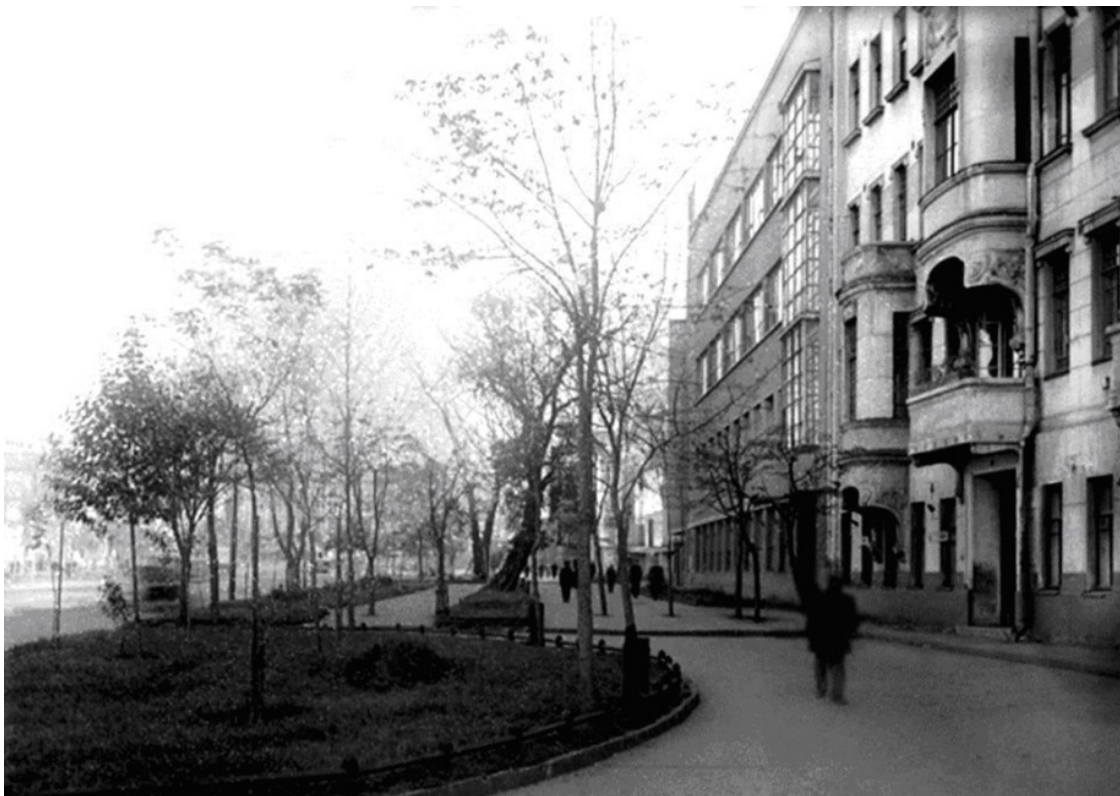
1933 г. Большая Садовая, дом № 10.