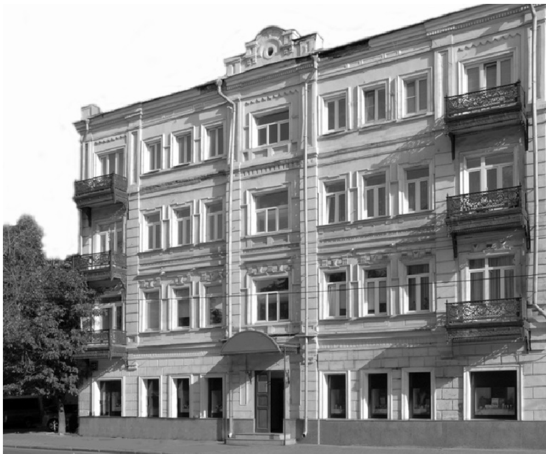
Большая Пироговская улица, дом № 35.

была горячей почитательницей Григория Ефимовича и не раз принимала его в своём доме, когда «святой старец» приезжал в Москву. Здесь можно было рассчитывать на хлебосольный приём – помимо доходных домов, семья владела торговым домом «И.С. Решетников и К°». К тому же один из сыновей покойного Ивана Степановича стал соучредителем «Лежнёвской мануфактуры», а другой – совладельцем красильно-аппретурной фабрики, которая принадлежала ему и во времена нэпа.