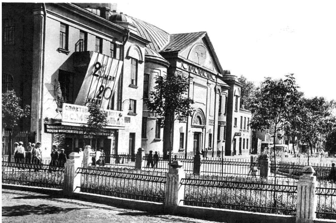
1933 г. Здание Мюзик-холла на Триумфальной площад.