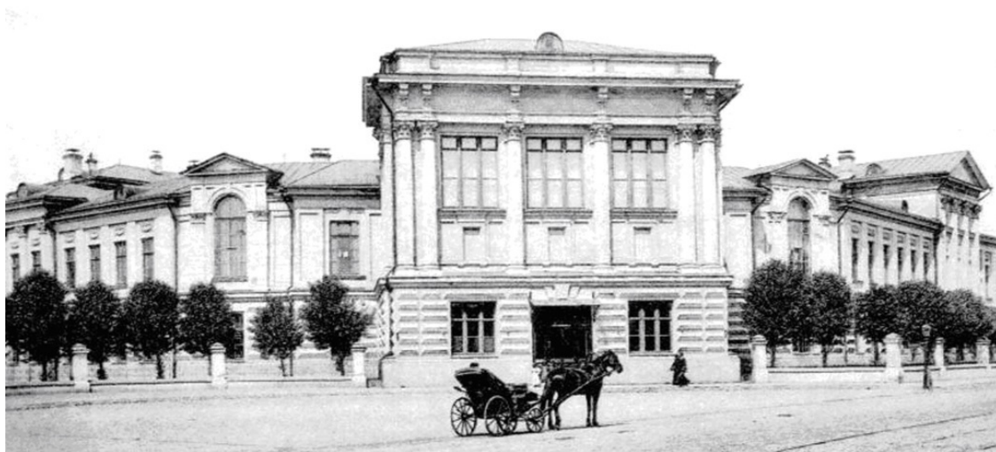
1907 г. Клиника кожных и венерических заболеваний напротив дома Решетниковых.

Напротив дома Решетниковых располагалось здание Клиники кожных и венерических заболеваний. Возможно, это совпадение, но в 1918 году у Булгакова был частный кабинет венеролога в Киеве.