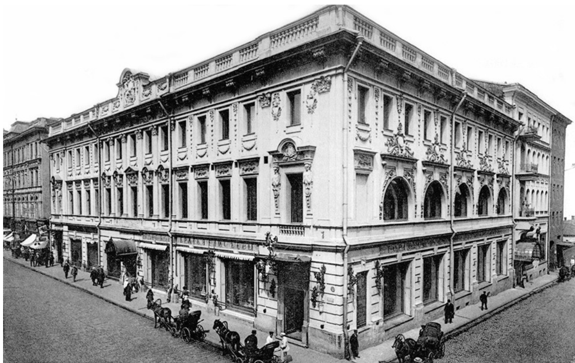
1900-е гг. Магазин Елисеева на Тверской улице.

Позднее дом на углу Козицкого переулка сменил несколько хозяев и, наконец, перешёл во владение Григория Елисеева. 23 января 1901 года в реконструированном здании открылся знаменитый «магазин Г.Г. Елисеева и погреба русских и иностранных вин». С 1921 года магазин Елисеева, переименованный в «Гастроном № 1», вновь стал символом сытой и счастливой жизни.