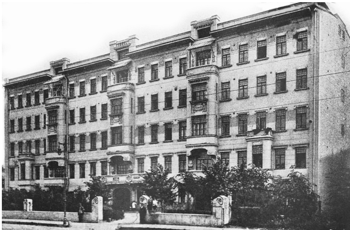
1923 г. Рабкоммуна в бывшем доме Пигита.

Пигит задумал построить ещё одно фабричное здание. Однако городские власти наложили запрет на промышленное строительство в этом месте, и в 1903 году здесь появился пятиэтажный доходный дом, известный москвичам как дом Пигита.