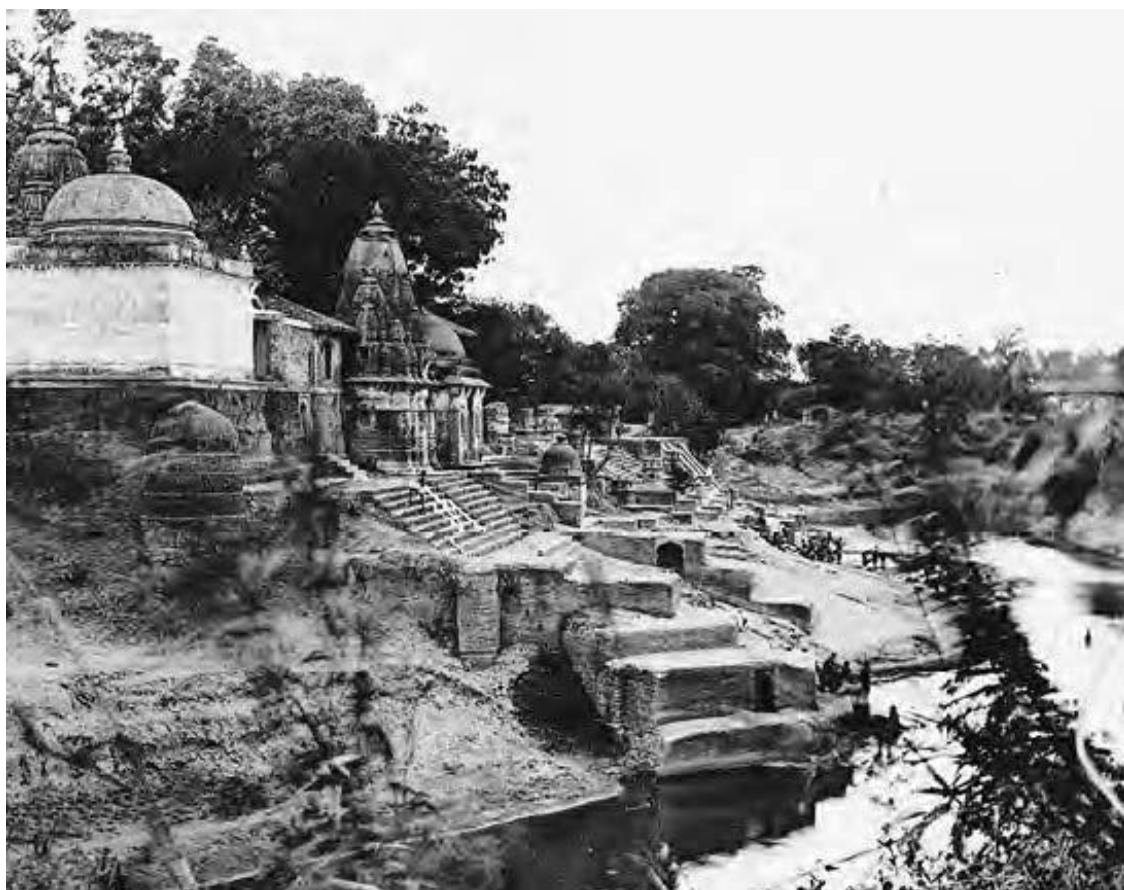
Храм Камнатх в Бароде ( Махараштра, фотография нач. XX в. )