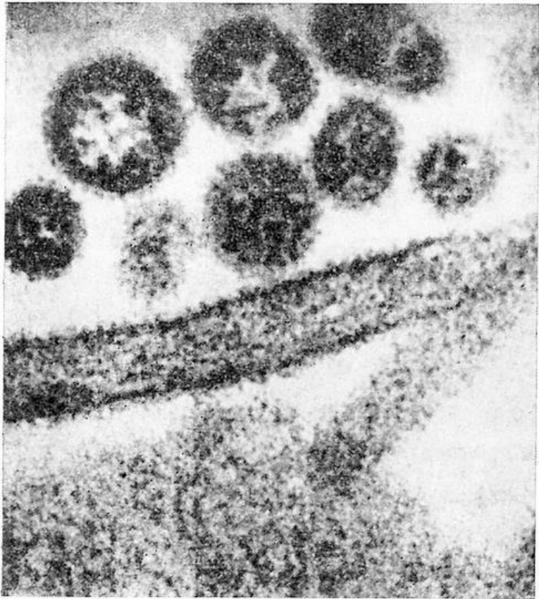
Рис. 1. Вирус лихорадки Ласса. Электронная микрофотография, увеличение в 103 000 раз.

В период с июля по ноябрь 1976 года в Южном Судане, в поселке Джуба и деревнях Мариди и Нзара было зарегистри-