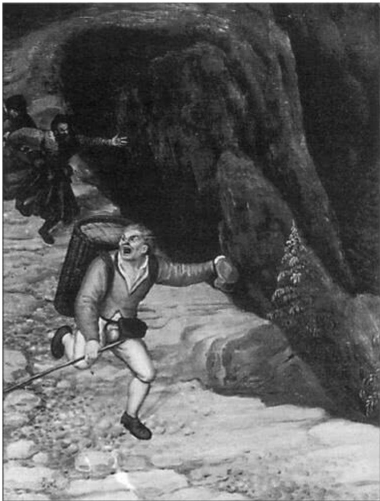
Одинокий торговец попадает в засаду разбойников; де-