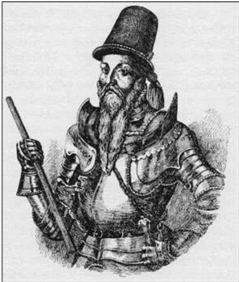
Осуждаемый всеми Альбрехт II Алкивиад, маркграф Бранденбург-Кульмбаха, источник несчастий семьи Шмидтов из Хофа (ок. 1550 г.)