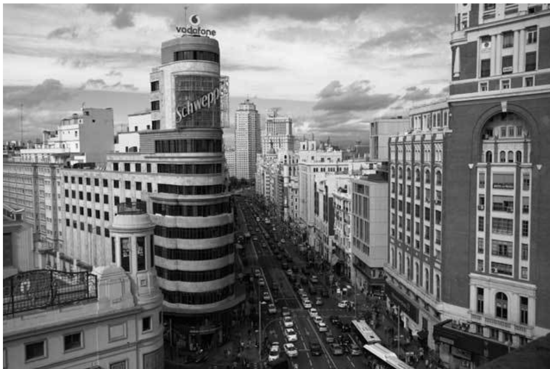
Вид на Гран-Виа с крыши универмага Эль КORTE Инглес

Бренди в дворцовом кафе подают в огромных литровых бокалах: бренди-то там 50 граммов, на доньшке, но бокал в руке не удержишь!