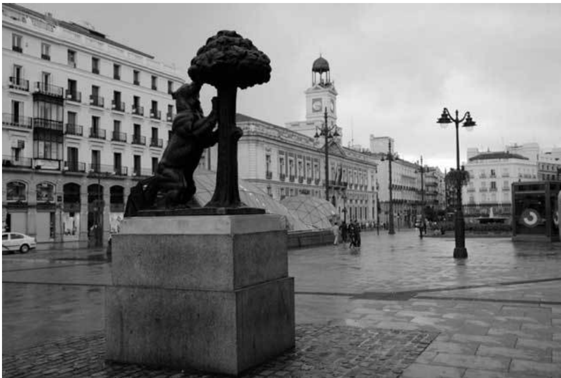
Медведь и земляничное дерево

«Там, где пересекаются все пути, где даже не придумаешь моря, но куда всегда возвращается беглец, – позвольте рассказать мне о Мадриде», – пел в старой песенке хрипловатым, совсем не музыкальным голосом бард Хоакин Сабина, перебирая струны гитары.