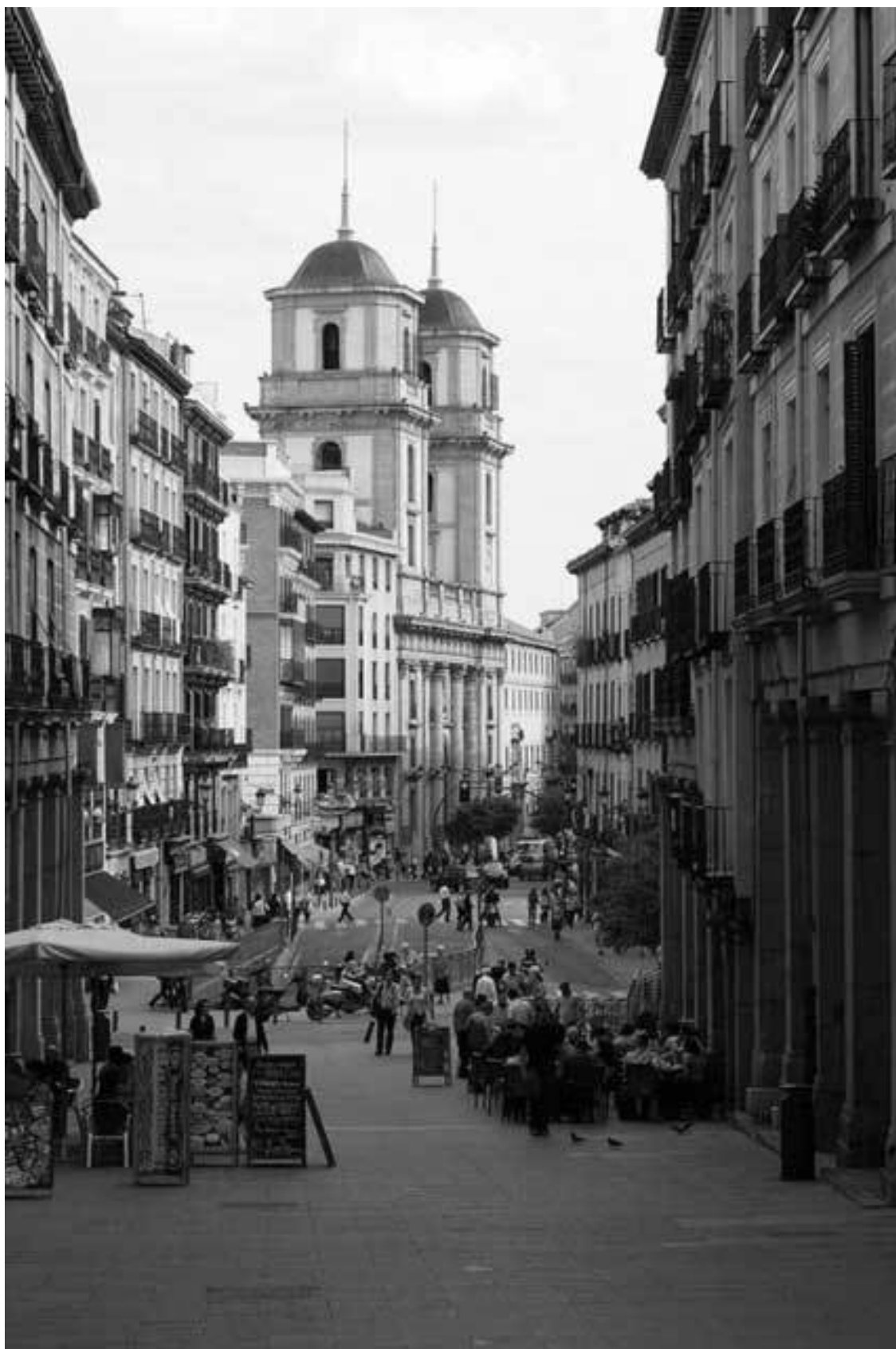
Башни храма Сан-Исидро

Исидро женился на Марии Торриб, впоследствии известной как святая Мария де ла Кабеса. К этому времени хозяин уже сделал его управляющим всеми своими поместьями.