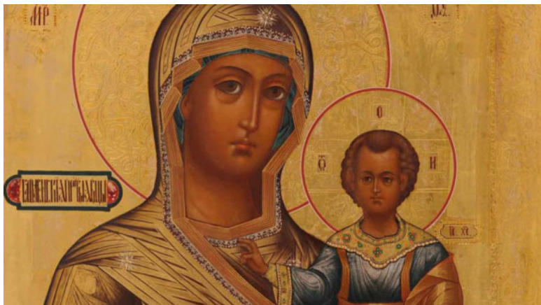
Икона Смоленской Божьей Матери. Одигитрия

Нравилось русским князьям брать в жёны иноземных красавиц. То из Англии, то из Литвы, а чаще всего – из Византии. Вот и черниговский князь Всеволод, сын Ярослава Мудрого, высмотрел себе невесту в Константинополе. Его избранницей была Анна, дочь императора Константина IX. В 1046 году, отпуская дочь на Русь, император благословил её древним, чудотворным образом Богородицы с младенцем. Церковники утверждают, что это прижизненный образ Божьей Матери, написанный евангелистом Лукой.