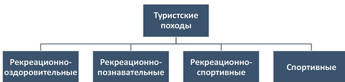
Рис. 1 Классификация туристских походов на основании цели их проведения

Как и в материале предыдущих лекций, классификацию начнем с важнейшего основания – цели похода (Рис. 1). Туристские походы, согласно своей цели , подразделяются на походы рекреационные (учебно-рекреационные) и походы спортивные (учебно-спортивные) . Учитывая ранее указанную классификацию рекреационного туризма, мы можем, в свою очередь, рекреационные походы подразделить на походы рекреационно-оздоровительные (их в литературе принято называть просто оздоровительными), рекреационно-познавательные (например, экологические походы), рекреационно-спортивные (например, приключенческие). Доминирующими целями рекреационно-оздоровительных походов являются – полноценный отдых и оздоровление их участников. Перед рекреационно-познавательными походами, кроме того, ставятся еще и познавательные (образовательные) цели и задачи.