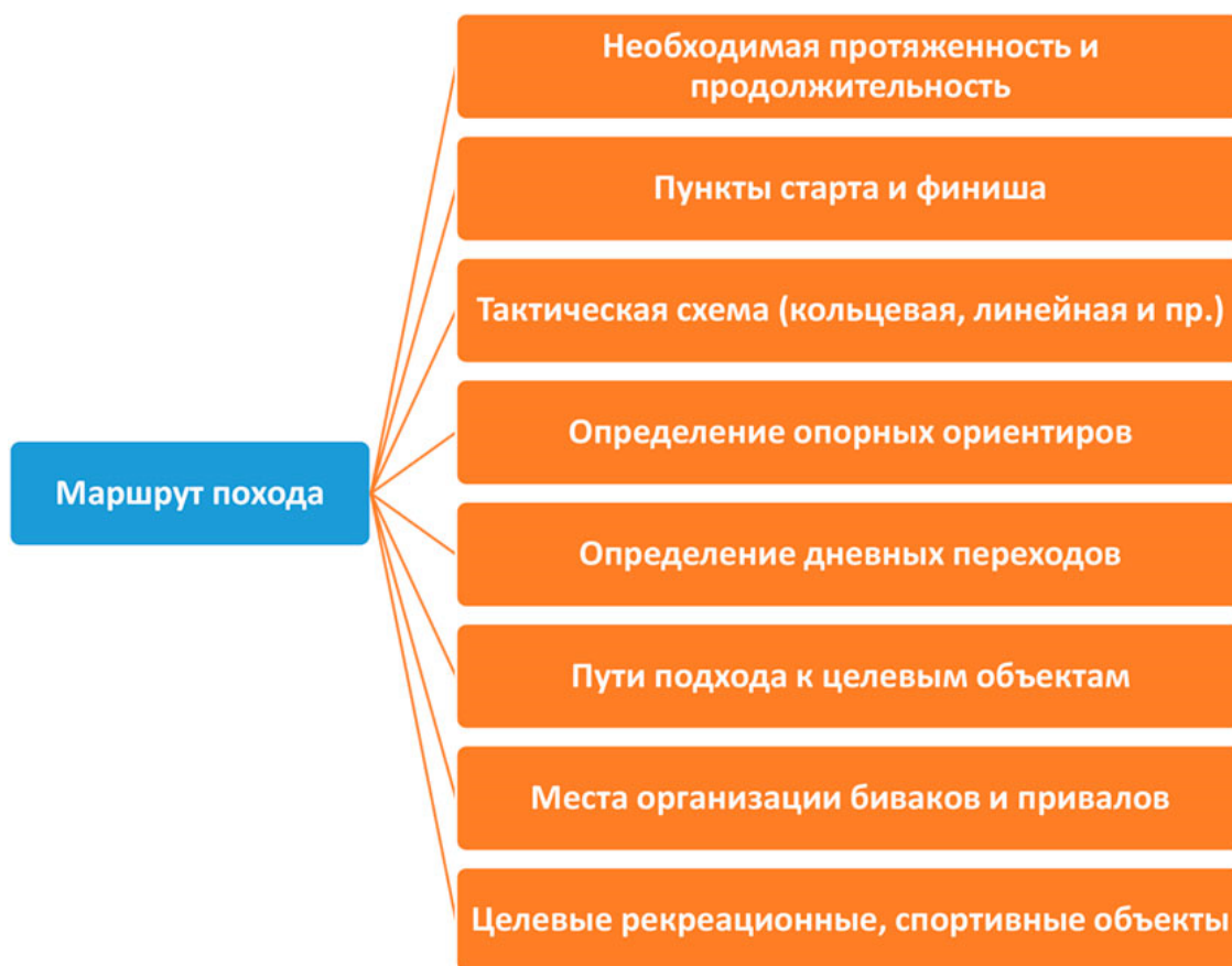
Рис. 3 Действия по разработке маршрута рекреационного и спортивного походов.

Комплектование группы оздоровительного похода. Организация туристского похода непременно включает и комплектование группы . В случае рекреационных походов, нормативные ограничения по составу группы существуют для походов с учащимися (регламентируются вышеупомянутой «Инструкцией» Министерства образования). Инструкцией регламентируется количество учащихся при проведении походов – их в группе должно быть не менее шести. Кроме того, определен минимальный возраст, с которого учащиеся допускаются к участию в походе – шесть лет. В иных случаях, каких-либо нормативных ограничений по составу туристской группы нет.