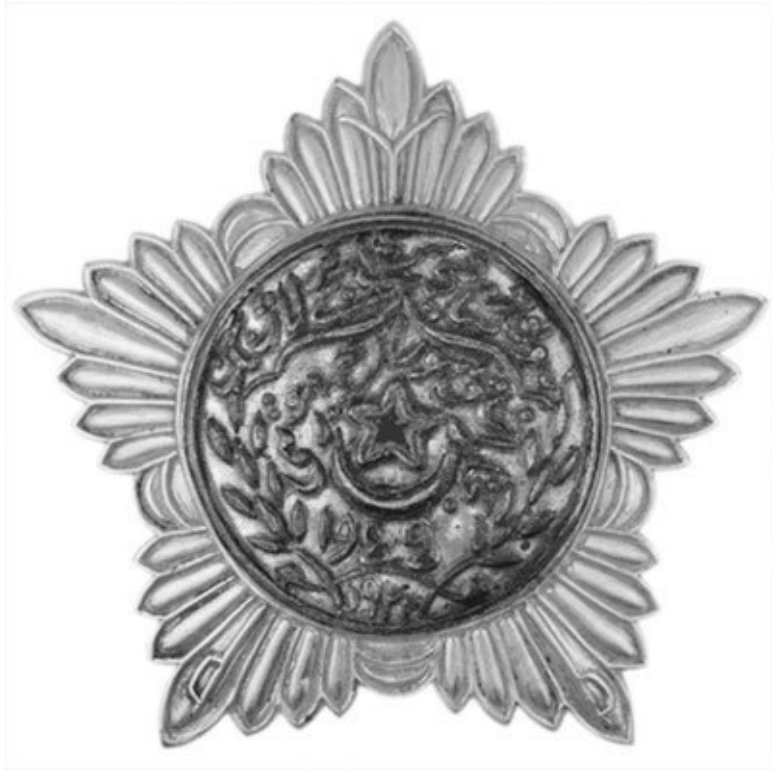
Орден Красной Звезды Бухарской НСР

На Ленинградском Монетном дворе всего было изготовлено 5000 таких знаков. Однако в связи с тем, что выдано было только около 3000, остальные были переплавлены.