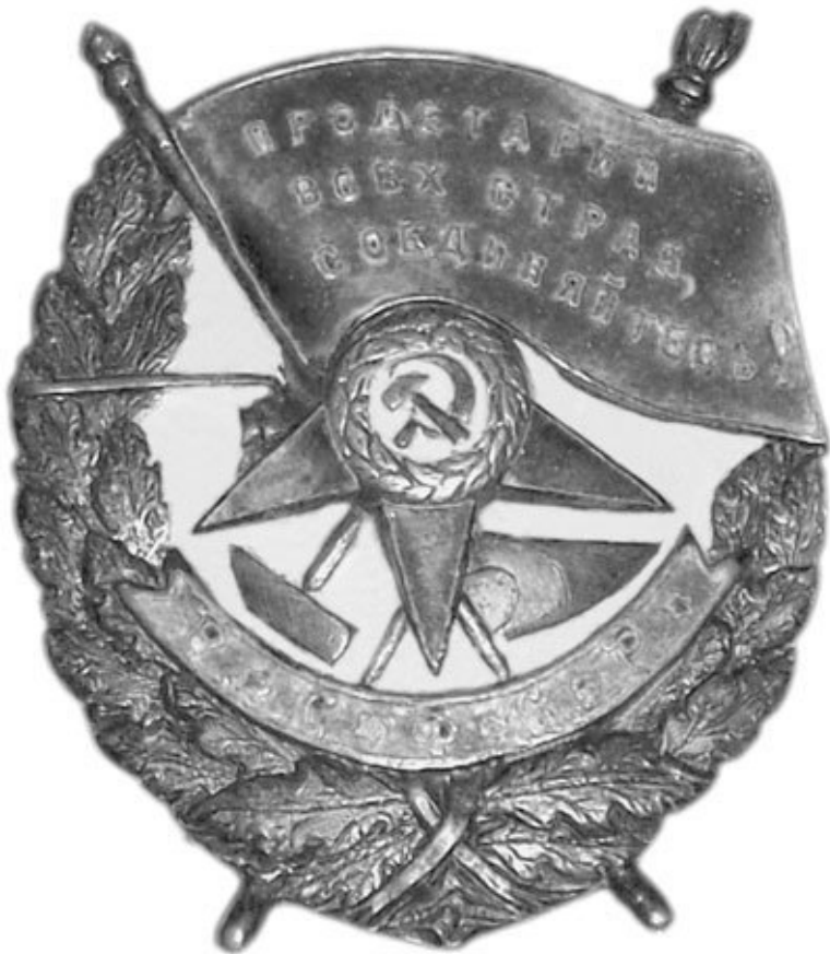
Орден Красного Знамени (РСФСР)