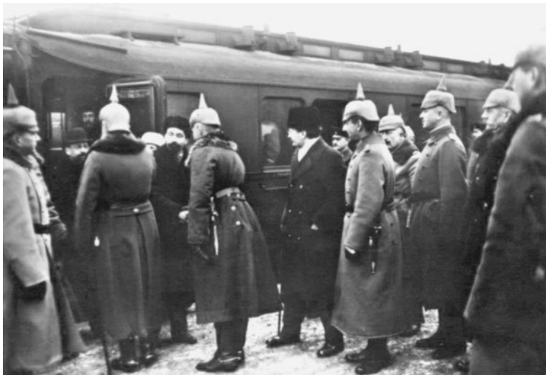
Отъезд советской делегации из Брест-Литовска. 1918 г.

Россию обязали заключить мир с Украинской Радой и вывести свои части с Украины, отказаться от претензий на Финляндию и Балтийские страны, отдать Турции Карс, Батум и Ардахан. К слову сказать, на этих территориях проживало 26 % населения, производилось 32 % сельскохозяйственной и 23 % промышленной продукции, 75 % угля и железа.