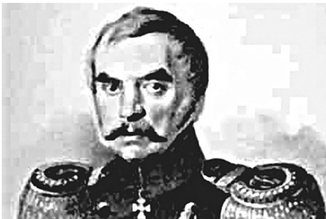
Генерал-лейтенант А. А. Вельяминов

Полковник Засс, увидев грустную картину вверенного ему участка, простиравшегося от Каменного моста у самого Карачая до станицы Николаевской, немедленно принял решительные меры к устранению многих неудобств: передвинул на другие пункты некоторые посты,