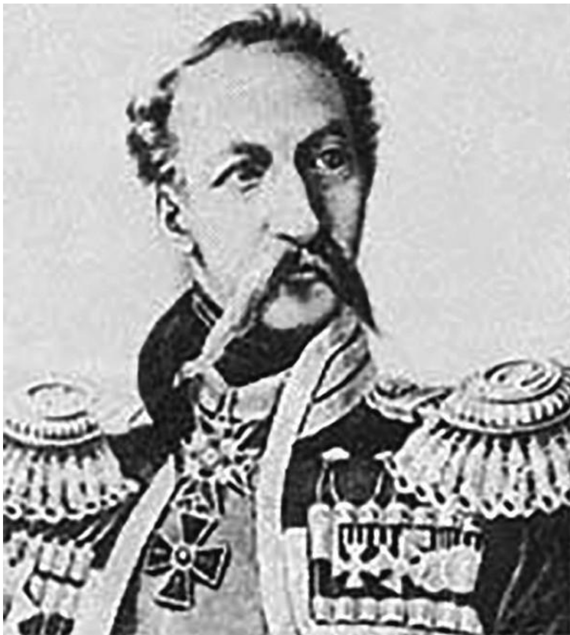
Генерал-майор Г. Х. Засс

В 1835 году, при постройке Зассовского укрепления, лазутчик дал знать, что сборище горцев, до двух тысяч человек, пробирается у самой подошвы гор по направлению Баталпашинской станицы, намереваясь напасть на станицу Беклеевскую или Боргустанскую Волжского полка; если же не удастся успеть в этом, то, по крайней мере, угнать скот и лошадей.