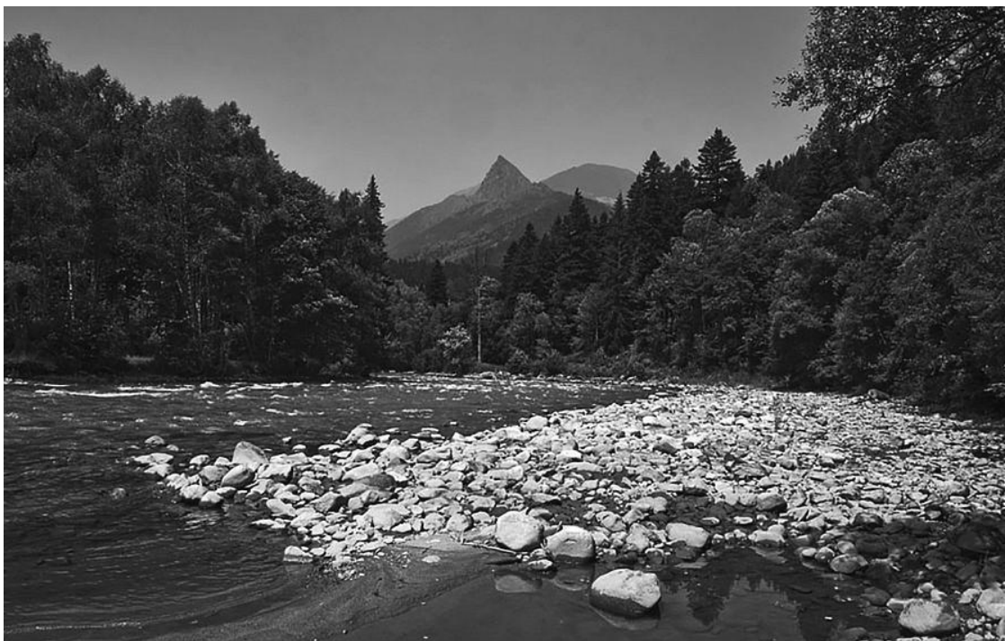
Верховья Большой Лабь

Обеспечив Кубанскую линию от набегов племен, считавшихся мирными, живших в местностях между реками Кубанью и Лабюю, барон Засс начал сам делать набеги за реку Белую, в верховья реки Пшехи, на аулы по Пшехе, и в Курджипское ущелье, где жили абадзехи.