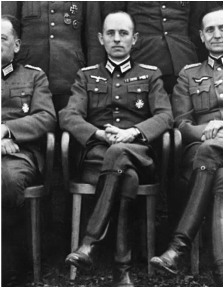
Руководитель Отдела изучения армий Востока (ОКН/