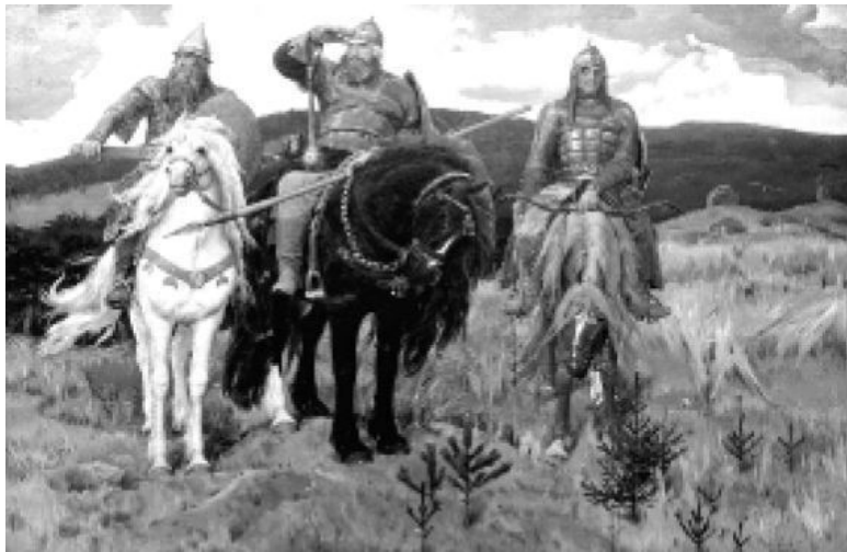
Рис. 3. «Богатыри». Картина В. М. Васнецова. 1881–1898 годы. Государственная Третьяковская Галерея. Москва.