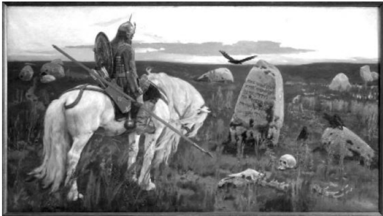
Рис. 4. «Витязь на распутье». Картина В. М. Васнецова. 1882 год. Государственный Русский Музей. Санкт-Петербург. Взято из Интернета.