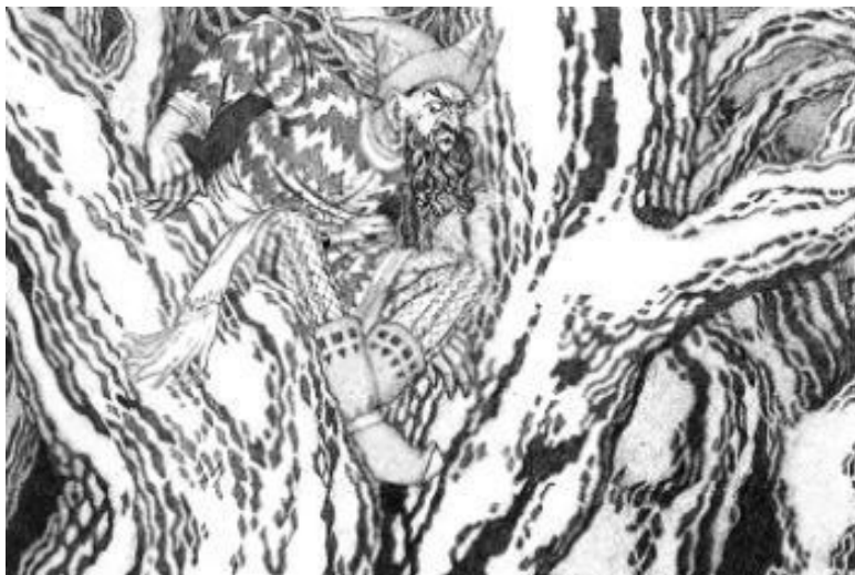
Рис. 2. Соловей Разбойник в ветвях дуба.

На самом деле, русские былины куда глубже и содержательнее, чем сегодня считается. Они доносят до нас подлинную историю Руси XIII–XVI веков. Об этом, – в том числе о знаменитом Соловье Разбойнике и легендарном острове Буяне, – рассказывает наша книга.