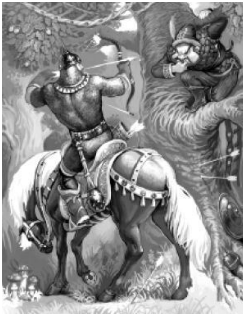
Рис. 1. Илья Муромец сражает каленой стрелой Соловья