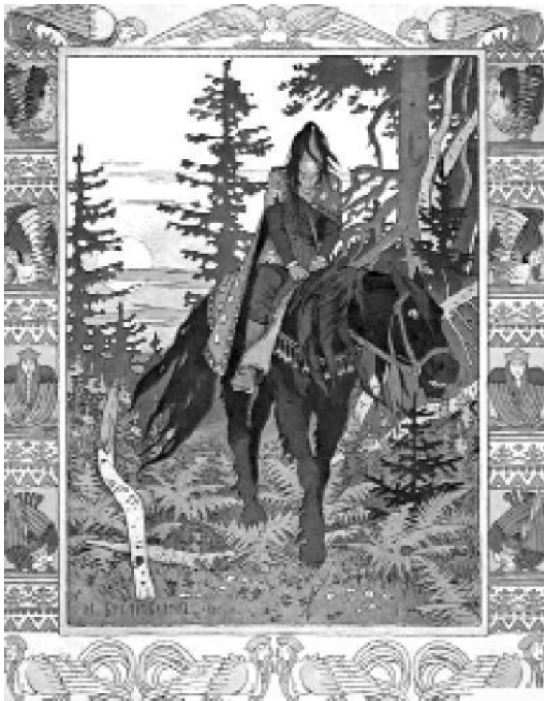
Рис. 5. Богатырь. Иллюстрация И. Я. Билибина. 1900 год.