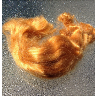
Red Eri Fiber