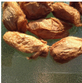
Red Eri Cocoons