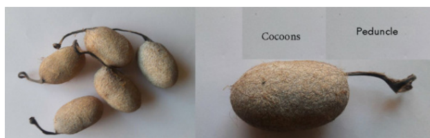
Tassar Cocoons with Peduncle