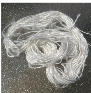
White Sari Yarn 600 meters 100 grams