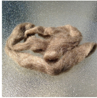
Peduncle Tassar Fiber