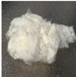
Eri White Cake