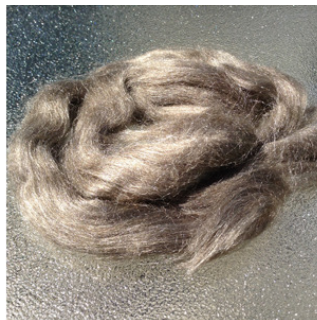
Peduncle Tassar Sliver