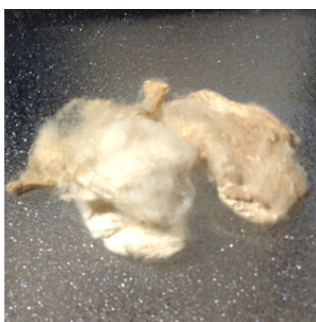
Red Eri Cake