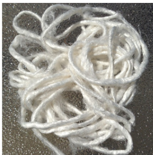
White Sari Yarn (100 meters in 100 grams)