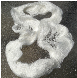
White Sari Yarn 2000 meters in 100 grams