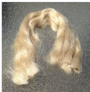
Golden Muga Fiber