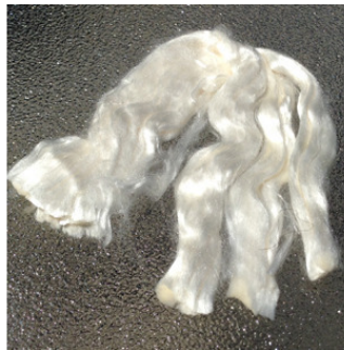
White Eri Fiber