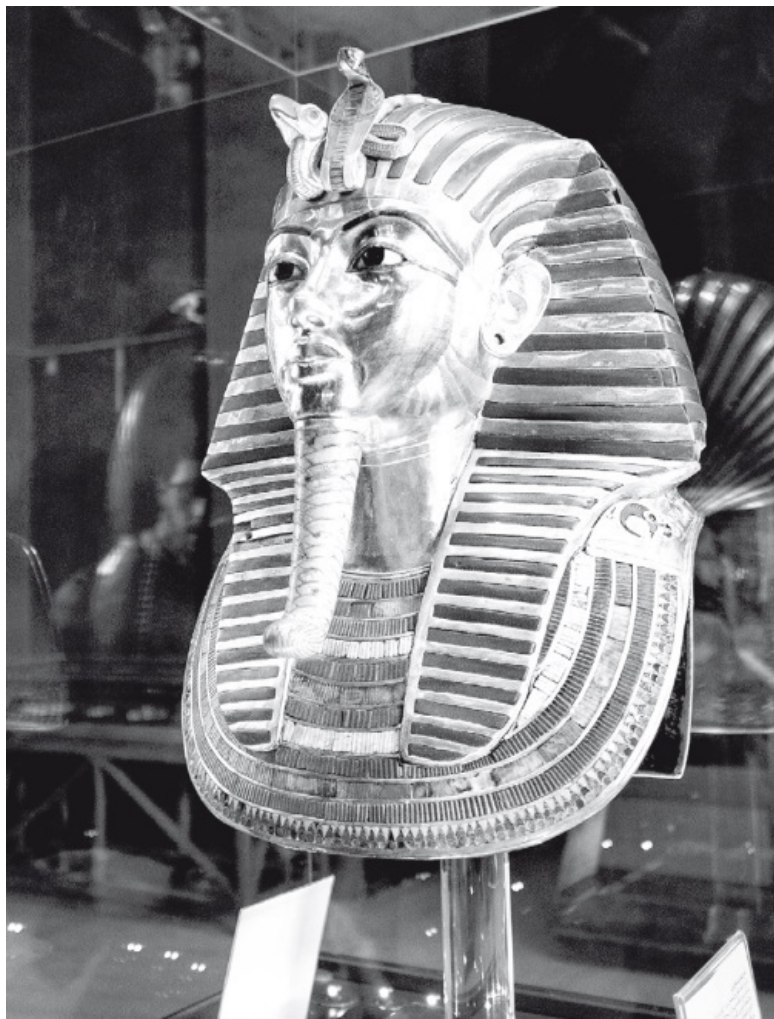
Погребальная маска фараона Тутанхамона.