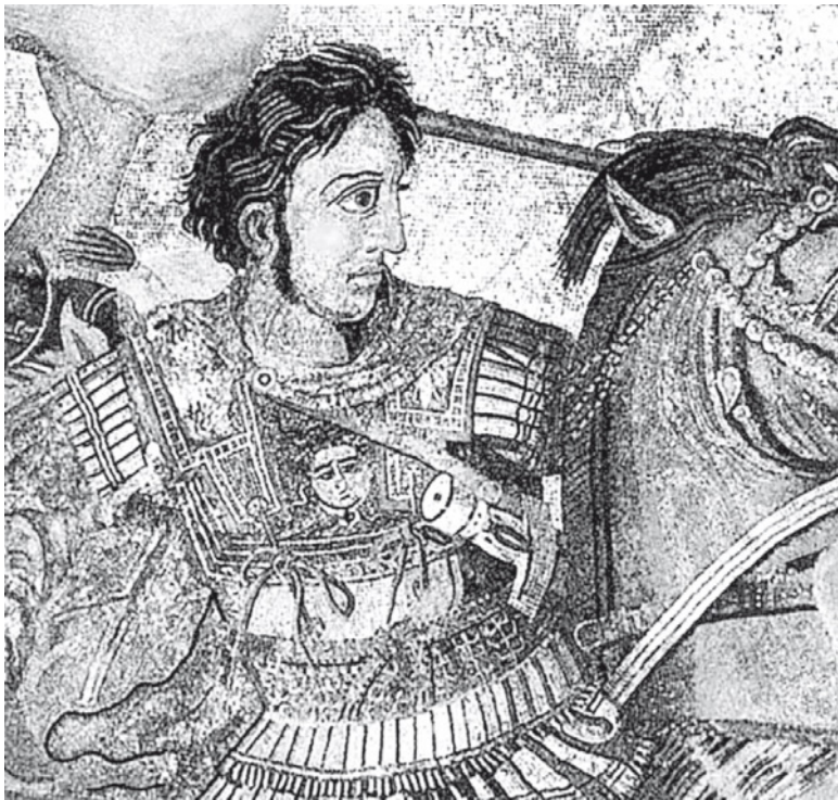
Изображение Александра Македонского. Мозаика. Ок. 100 г. до н. э. Археологический музей, Неаполь

В начале завоевательного похода Александр совершил многозначительный жест, который в наше время назвали бы красивым пиаром. Совершив богам моря возлияние из золотой чаши, он самолично встал за руль корабля и повел его к бухте, на берегу которой стояли гробницы троянских героев.