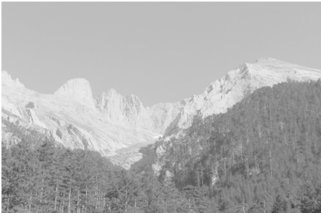
Илл. 1.2. Вид через ущелье на гору Олимп (2917 м). Греки верили, что на ее вершине обитают боги. Горный рельеф занимает бóльшую часть территории Греции

Греции одомашнили еще в конце каменного века, стали свиньи, овцы и козы. К VII в. до н. э. в Грецию с Ближнего Востока завезли домашних кур.