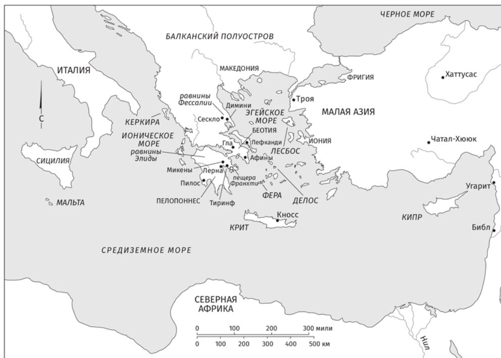
Карта 1. Неолитическая, минойская и микенская эпохи

Ход древнегреческой истории определялся благоприятными или неблагоприятными природными условиями и их влиянием на жизнь людей в этой части Средиземноморья. Родина древних греков – юг Балканского полуострова (территория нынешней Греции) и сотни островов, лежащих на западе, в Ионическом море, и на востоке – в Эгейском. Острова в этой части Средиземного моря разного размера – от крупных, таких как Лесбос (1632 кв. км) и Керкира (588 кв. км), до крошечных, подобных Делосу (3,37 кв. км). Греки также жили на западном побережье Малой Азии (в современной Турции) – вплоть до лежащего на юге большого острова Крит (8337 кв. км) и еще более крупного Кипра (9251 кв. км) на востоке, а также на побережье Северной Африки, юге Италии и Сицилии (области, известной из латинских источников под названием Magna Graecia – «Великая Греция»). Почти все места, где жили греки, были подвержены опустошительным землетрясениям.