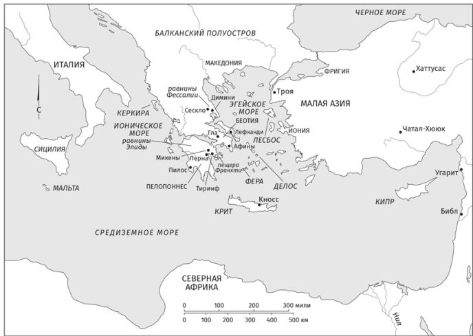
Карта 1. Неолитическая, минойская и микенская эпохи

В ландшафте континентальной Греции преобладают суровые горные хребты, окаймляющие равнины и долины, жители которых могли сохранять политическую самостоятельность друг от друга, поддерживая при этом торговые и дипломатические связи. Эти горы протянулись по Балканскому полуострову с северо-запада на юго-восток с одним узким проходом, соединяющим Грецию с Македонией на севере. Высочайшая вершина – гора Олимп (2917 м) (илл. 1.2). Поверхность большинства греческих островов тоже гористая и скалистая. Лишь 20–30 процентов суши пригодны для земледелия, однако некоторые острова, западное побережье Малой Азии, Великая Греция и некоторые участки территории