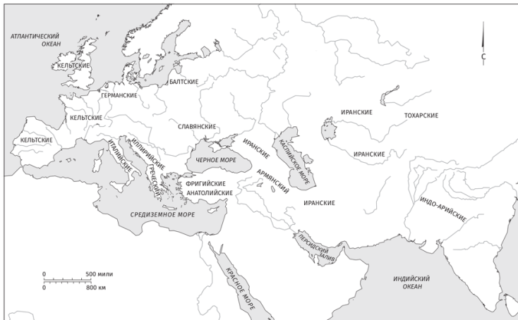
Карта 2. Ареал распространения индоевропейских языков

Концепция изначального индоевропейского единства строится на основе лингвистической реконструкции. Лингвисты давно солидарны в том, что древние и современные языки Западной Европы (включая, ко всему прочему, греческий, латинский и английский), а также языки славянские, персидский (иранский) и множество языков на Индостанском субконтиненте (в том числе санскрит) восходят к одному-единственному языку. Поэтому они назвали первоначальных носителей этого языка индоевропейцами. Поскольку первоначальный язык исчез задолго до изобретения письменности, его следы живут в словах образовавшихся на его основе более поздних языков. У древних индоевропейцев,