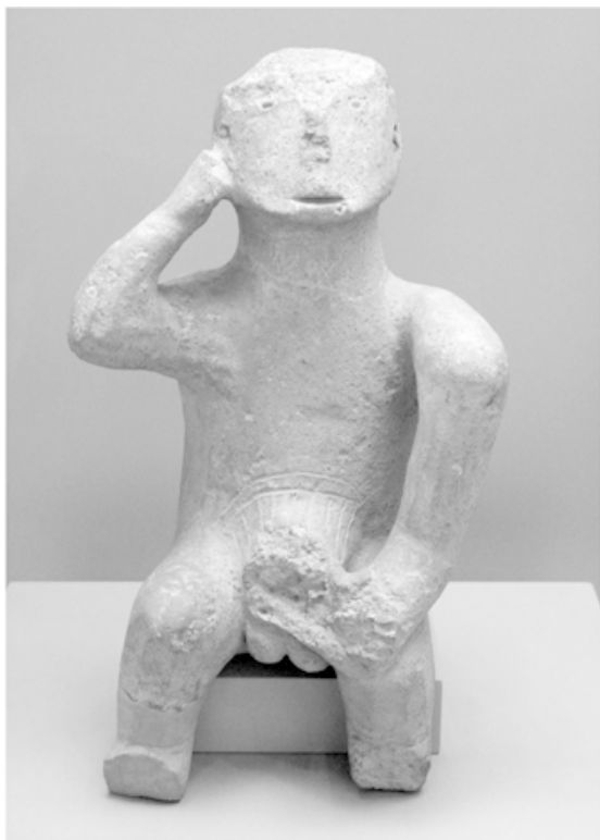
Илл. 1.3. Жители Греции в неолитическую эпоху создавали произведения искусства, в том числе и скульптуры. У этой сидящей мужской фигуры видны гениталии и эрегированный пенис (позже отколотый). Это привело некоторых ученых к мысли, что скульптура связана с производством потомства и плодородием — предметом постоянной заботы в мире, где многие умирали молодыми