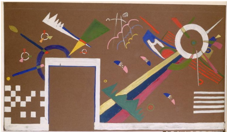
Василий Кандинский, эскиз мурала к Свободной выставке, Берлин, 1922

В последнее время много говорится и пишется об искусстве как производстве знания, о том, какими могут или должны быть педагогические методы искусства. Поэтому имеет смысл оглянуться назад, на ранний период истории современного искусства, – ведь художественный авангард не был чем-то само собой разумеющимся и должен был искать способы себя легитимировать, истолковать и объяснить. Одним из ранних и стилеобразующих примеров такой легити-