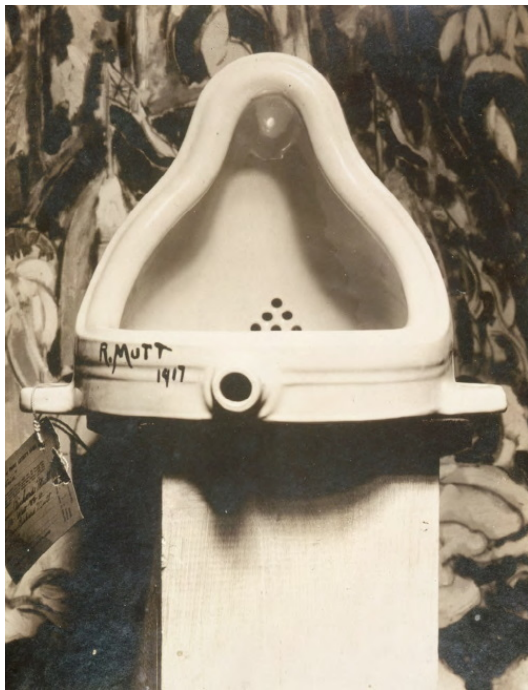
Альфред Стиглиц, «Фонтан» Марселя Дюшана, 1917