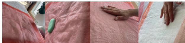
Making the fibers soapy

https://www.youtube.com/watch?v=zgBJT2T49OU