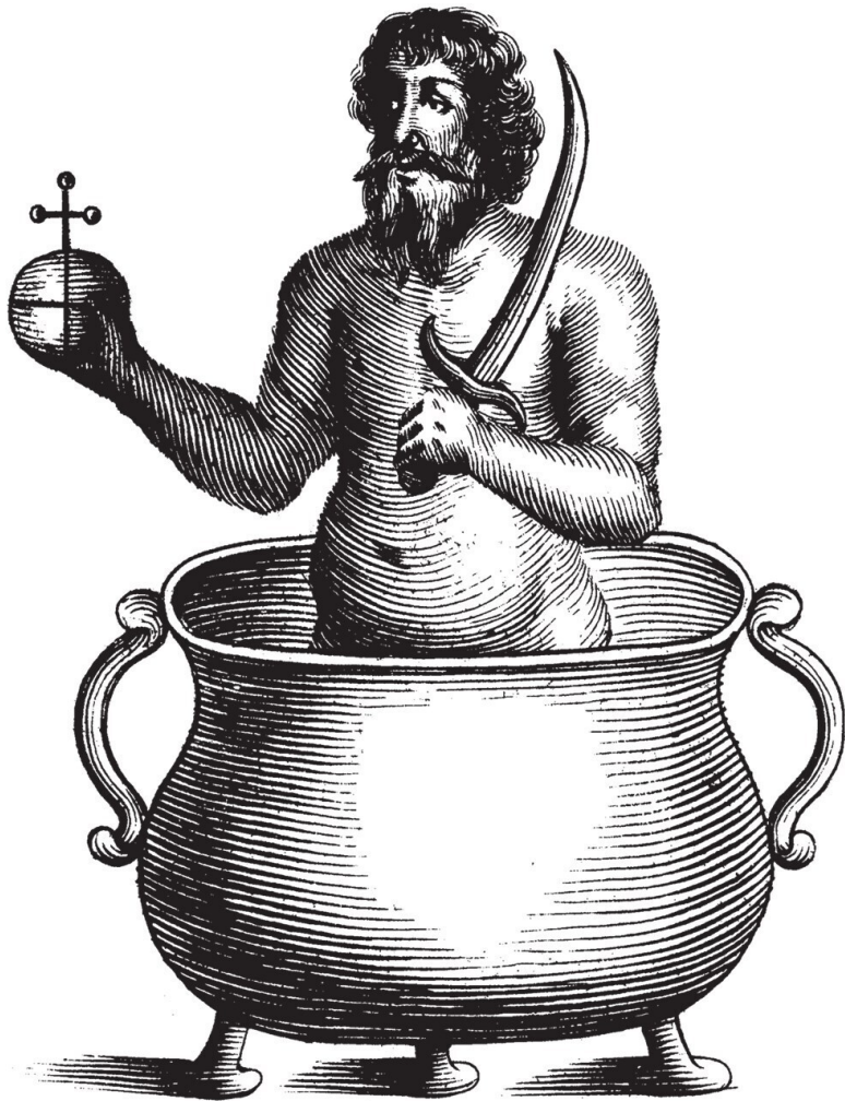
Лечение больного короля.