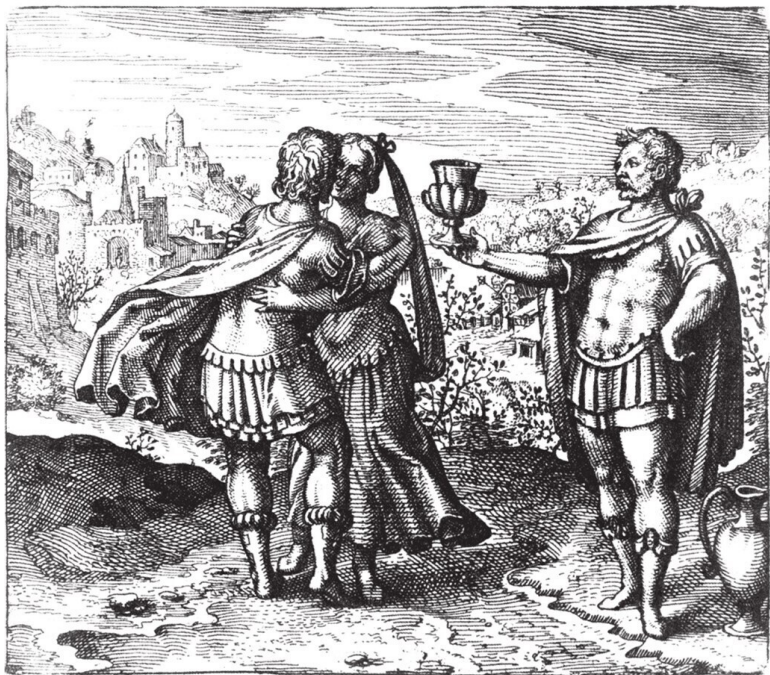
Инцест брата и сестры. Михаил Майер (начало XVII в.)

Здесь явно или скрыто проходит сравнение: сознание материальное, хаотическое и темное, скованное страстями и привычками, напоминает металл «низкий». Душа и дух застывают под тяжестью «земли». Напротив, сознание «озаренное» (металл «благородный») централизовано в своем автономном экзистенциальном модуле.