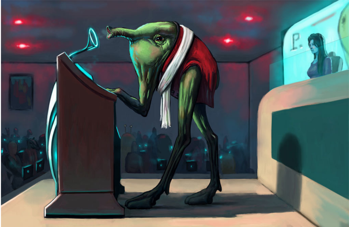
Модератор Федерации – Пакуа Чиарамонти (раса: унарианец, планета Унария)

– Этот Адмирал снова опаздывает. И так происходит всегда, когда нужно его присутствие, особенно в такой важный момент.