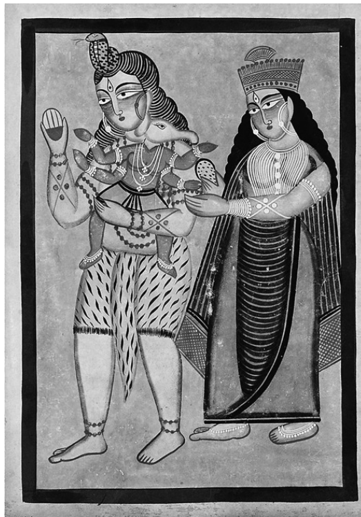
Святое семейство (Живопись, Бенгалия, XX в.)

1. 3) устами мудреца Нарады провозгласила, что рождение Ганеши приносит процветание и благополучие.