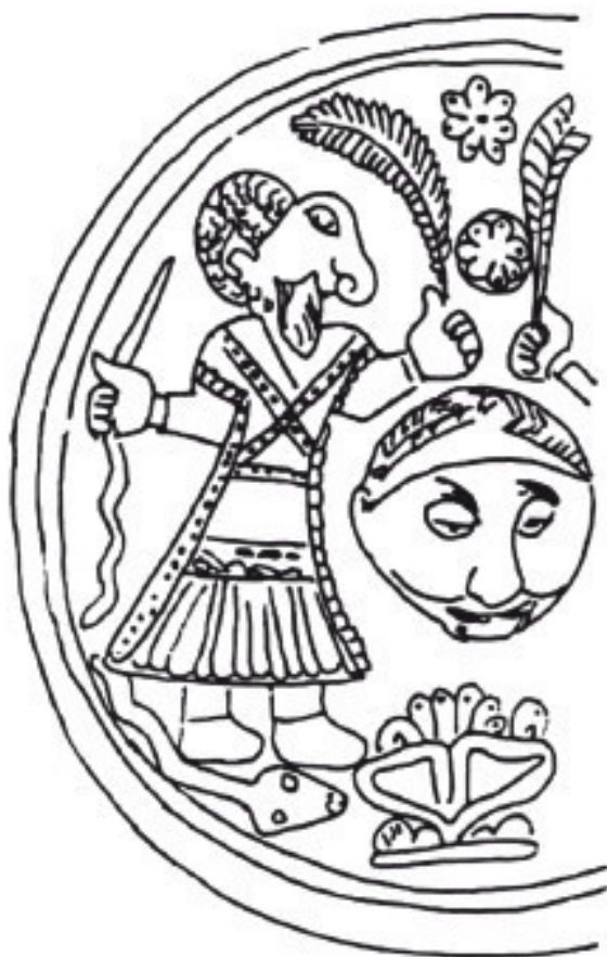
«Прото-Ганеша» из Луристана

Иногда в качестве доказательства существования культа Ганеши до нашей эры привлекается греко-бактрийский нумизматический материал. Многие монеты Греко-бактрийского царства, которое просуществовало немногим более ста лет (середина III века до н. э. – вторая половина II века до н. э.), являются замечательными образцами медальерного искусства. Как правило, на лицевой стороне изображался портрет правителя, а на обороте – покровительствующее ему божество 3 . Монеты, на которых есть изображение правителя в слоновьем головном уборе, С. Калита выделяет в отдельную группу (всего насчитывается 8 групп) (Kalita, 1997: 17). К такой же группе монет, безусловно, относится серебряная тетрадрахма с портретом царя Деметрия I (200–190 гг. до н. э.) в головном уборе в виде слоновьей головы (или шкуры с головы слона), а на реверсе изображен Геракл. Примечателен здесь изогнутый слоновий хобот наподобие древнеегипетского урея или латинской «s», который располагается на лбу Деметрия I.