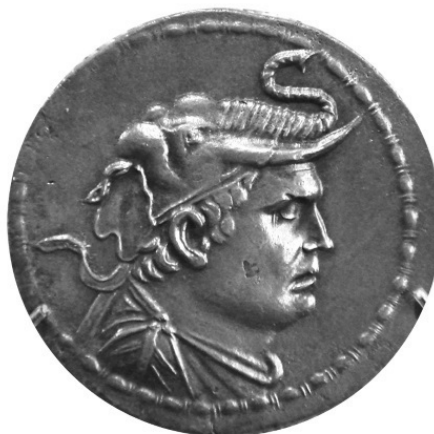
Монета Деметрия I в головном уборе в виде головы слона