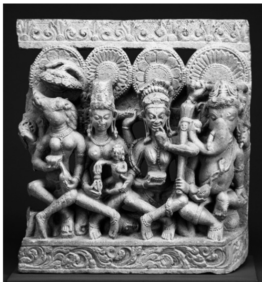
Ганеша с тремя из семи Матерей-богинь (Каменный барельеф, Индия, IX в. Денверский художественный музей)