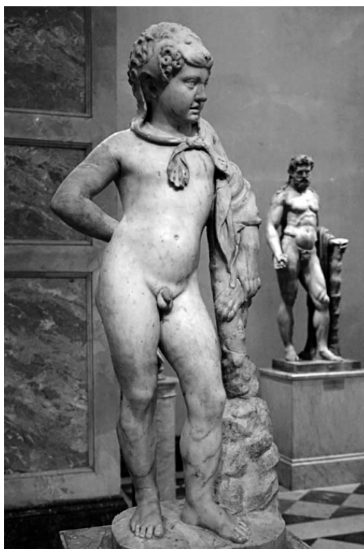
Геракл из Эрмитажа. Римская скульптура II в. по греческому образцу IV в. до н. э.

Очень вероятно, что именно образ Геракла в львиной шкуре явился прототипом для головного убора в виде слона на греческих монетах, и нет никаких оснований связывать его с Ганешей. Здесь более вероятна связь с Африкой, нежели с Индией. А вот о существовании на территории Индостана культа слона в древности имеется достаточно свидетельств. По крайней мере, археологические находки говорят об особом отношении к этому животному и о его достаточно высоком статусе в древних культурах.