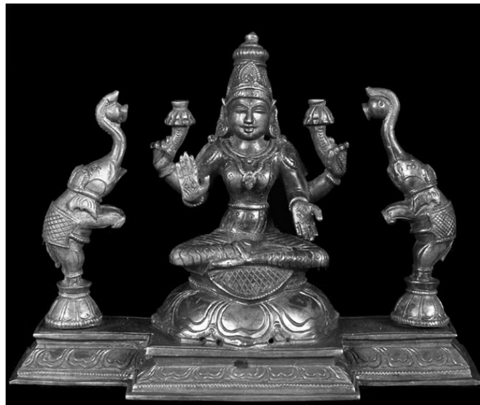
Гаджа-Лакшми (Бронза, XX в.)

Как и Ганеша, Кубера является одним из дикпалов, выполняя функцию стража и охраняя северное направление 36 . Свиту Куберы составляют гухьяки, киннары, гандхарвы, апсары. Он, как и Ганеша, близок к Шиве, у обоих почитатели просят богатства, материальных благ, успеха, удачи. Кроме того, в «Вишнудхармоттара-пуране» говорится, что женой Куберы является Риддхи – персонификация процветания. В иконографии она изображается сидящей на его левом колене (Banerjēa, 1956: 339). Но Риддхи считается также женой Ганеши. Но несмотря на наличие общих черт, у Ганеши и Куберы имеются принципиальные отличия. Ганеша – сын Шивы, а Кубера – почитатель Шивы; Ганеша – повелитель ганов, а Кубера – один из ганов.