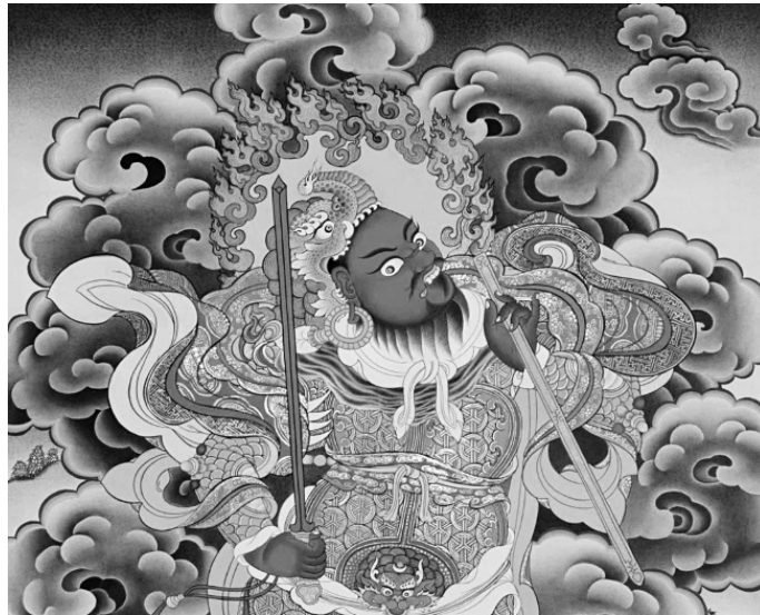
Вирудхака (Танка, Непал, XX в.)

Есть один любопытный момент, имеющий отношение к Санчи. Кушманды, или кумбханды, – существа, стоящие в одном ряду с пишачами, претами, праматхами и прочими низшими существами. О них упоминали ранние буддийские тексты, их изображали в скульптуре. Предводителем этих существ является Вирудхака. В более позднем буддийском искусстве этот Вирудхака изображался в головном уборе в виде головы слона (точно таком же, как на греко-бактрийских монетах), например, в живописи копанского монастыря в Непале или румтекского монастыря в Сиккиме, а в VII веке о нем говорится как о Господине Юга и Господине слонов. Хотя на воротах Санчи у Вирудхаки нет головы слона, сам факт, что он Господин слонов, который отвечает за южное направление, заслуживает внимания. Ведь в более поздней пуранической мифологии Ганеша считается стражем именно южного направления. И если сами кушманды Санчи изображены в образе карликов, то Вирудхака имеет вполне нормальную внешность. Кроме того, в одной надписи из Санчи (примерно III век до н. э.) Винаяка упоминается как положительный персонаж, без какой-либо привязки к коварным винаякам (Bermijn, 1999: 51).