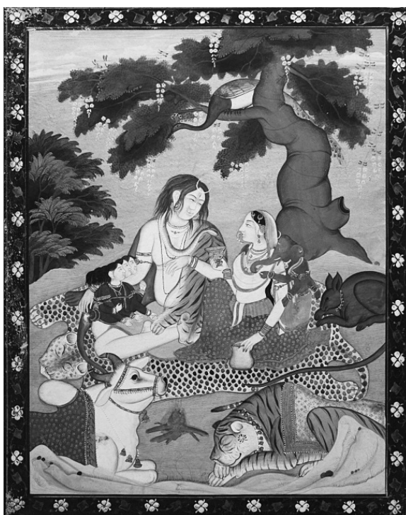
Святое семейство (Современная миниатюра в стиле Кангра)

Любопытные параллели имеются в ведийском и брахманическом ритуале, когда поэтапно воссоздается тело пуруши, что, по мнению П. Б. Кортрайта, напоминает процесс создания Ганеши (Courtright, 1985: 54–55). П. Б. Кортрайт высказывает предположение, что символику создания Ганеши можно понять только через призму ведийского ритуала, рассматривая процесс сотворения сына богиней как своеобразный отголосок ведийской культуры, которая, как известно, была ориентирована на ритуал.