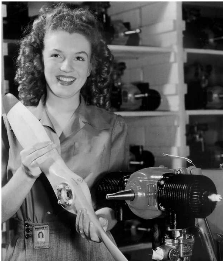
Работница Radioplane company (1944)