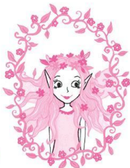
Мама Графиня Корделия Мун