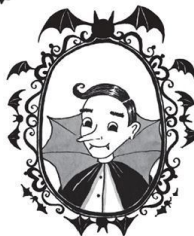
Папа Граф Бартоломью Мун