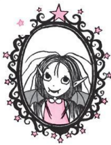
Я! Изадора Мун