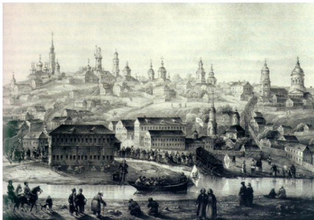
Воронеж. Петровский о. и цейхгауз. XVIII век.

Так указом Петра в 1586 году этот город, помещавшийся вдали от морей и океанов, стал крупнейшим центром кораблестроения на Руси, причем все корабельные мастера были российского происхождения. Большой частью местные, поскольку они и до этих указов строили большие ладьи для купцов.