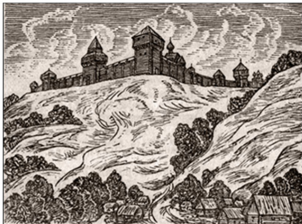
Крепость Воронѣг, XVII век