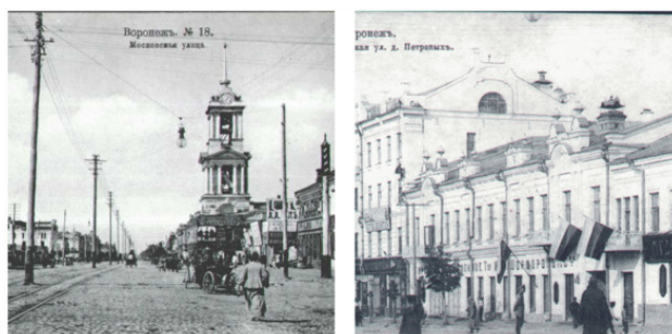
Улицы старого Воронежа

В 1845 году открылся Воронежский кадетский корпус имени Великого князя Михаила Павловича, в котором обучались оружейник – изобретатель легендарной «трехлинейки» С. И. Мосин, знаменитый естествоиспытатель А. Н. Лодыгин, революционный демократ Г. В. Плеханов и др. Здесь родились знаменитые писатели И. А. Бунин, С. Я. Маршак, А. П. Платонов.