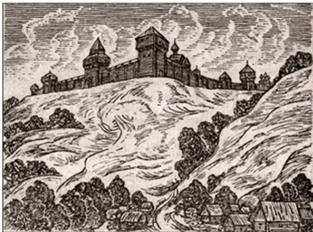
Крепость Воронѣг, XVII век