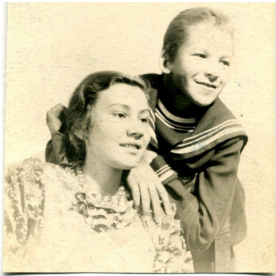
«Дети капитана Гранта»

не мог играть, поэтому начали с плавания. Выглядело это так. Правый берег реки был обрывистым. Родители раскачивали меня, держа за руки и ноги, кидали прямо с обрыва в воду, затем прыгали в воду сами. Я барахтался, а они страховали меня и обессиленного вытаскивали на берег. Так продолжалось несколько дней, и постепенно я начал уверенно чувствовать себя в воде. Через короткое время я стал уже самостоятельно переплывать реку, благо течение в наших местах было не быстрым, а сама река – не слишком широкой.