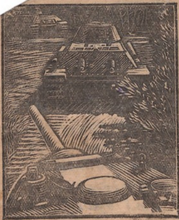
В ДЕЙСТВУЮЩЕЙ АРМИИ. Советские тяжелые танки на марше.