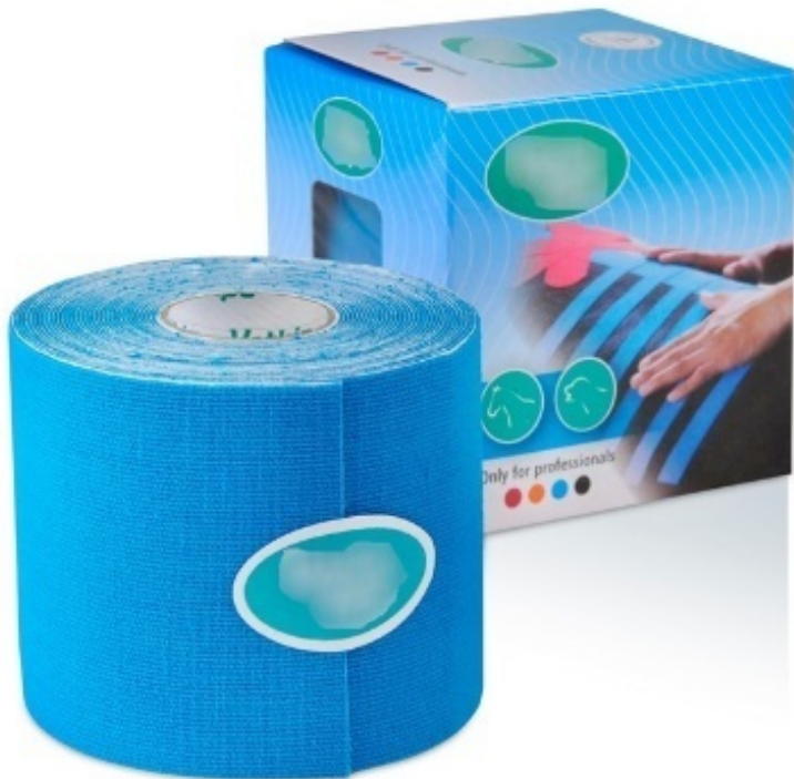
Рис. 5. Пример ветеринарного кинезиологического тейпа.