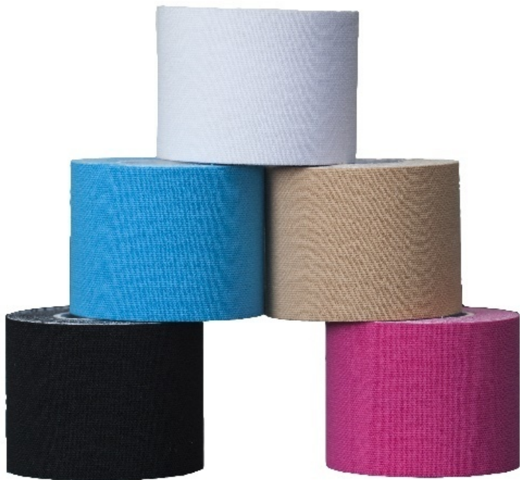
Рис.6. Основные цвета классических кинезиологических тейпов.