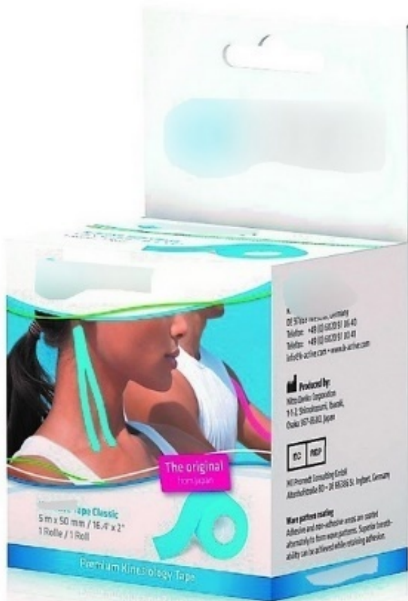
Рис. 3 А, Б. Примеры классических кинезиологических тейпов.