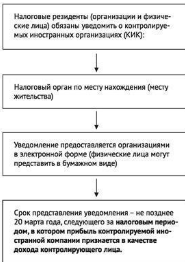
Рис.7: Обязанность по уведомлению о КИК

Указанные обязательства не возникают, если участие в иностранных организациях реализовано исключительно через прямое и (или) косвенное участие в российских публичных компаниях.