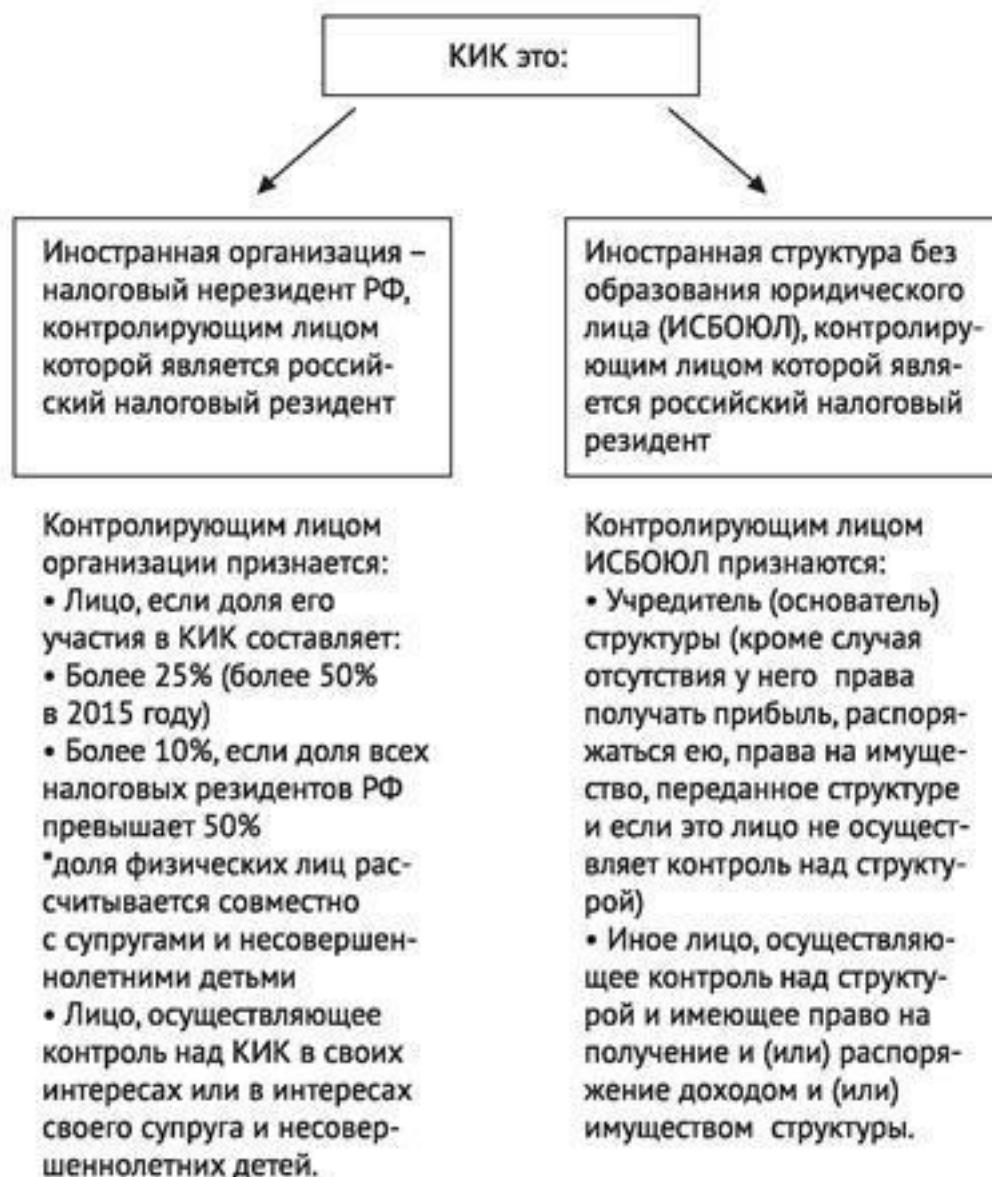
Рис. 3: Понятие контролируемой иностранной компании и контролирующего лица