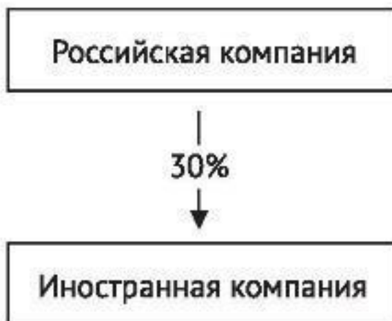
Рис. 4: Доля прямого участия РосКо в ИнКо

Долей косвенного участия физического лица/одной организации в другой организации признается доля, определяемая в следующем порядке: