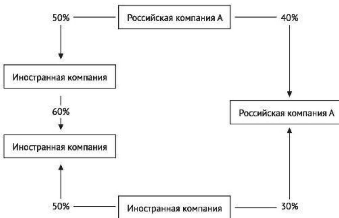
Рис. 5: Доля косвенного участия одной организации в другой